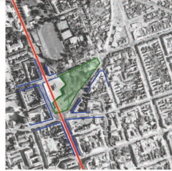
térfalak, főutengely tér megnyitása a park irányába