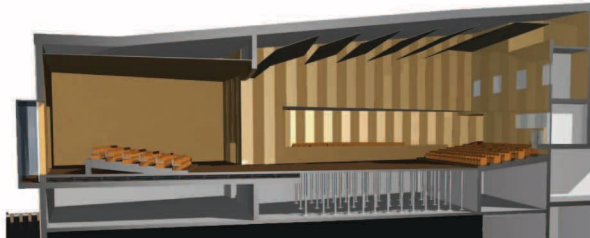
egyszerű eszközökkel, gyorsan kialakítható pl. arénaszínpadi elrendezés a nézőtéri széksorok kiegészülnek a színpadon el- helyezhető mobil dobogókából álló széksorokkal a mobil jelzőrendszer és a széksorok a déli oldalon lévő szőnyegterületen tárolhatók a nézőtér síkját beépített emelőlvel lehet kiegyenlíteni, ezzel színpaddá alakítani Ebben az esetben is kb. 550 fős nézőtér alakítható ki.