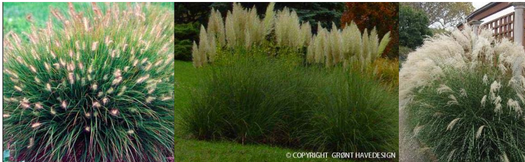
Pennisetum alopecuroides Magic - tollborzfü Cortaderia sellona 'Pumilla' - törpe pampafű Miscanthus sinensis Yaku Jima - japánfü