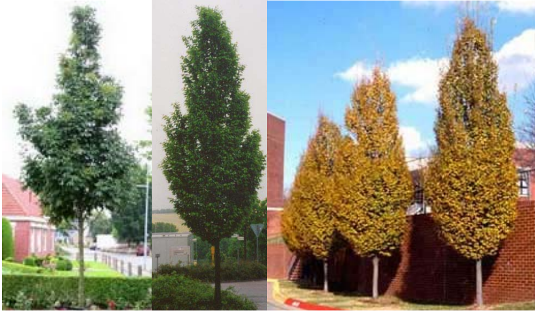
Fraxinus ornus 'Obelisk oszlopos virágos kőris Carpinus betulus 'Fastigiata' – oszlopos gyetyán