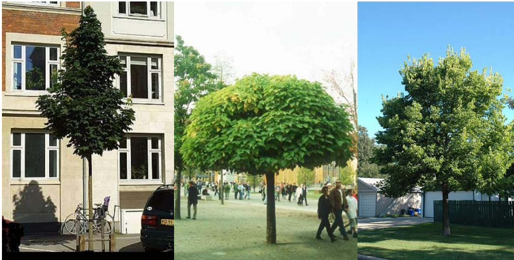
Acer platanoides 'Olmsted' – oszlopos juhar Catalpa bignonioides 'Nana' – gömb szivarfa Celtis occidentalis – nyugati ostorfa