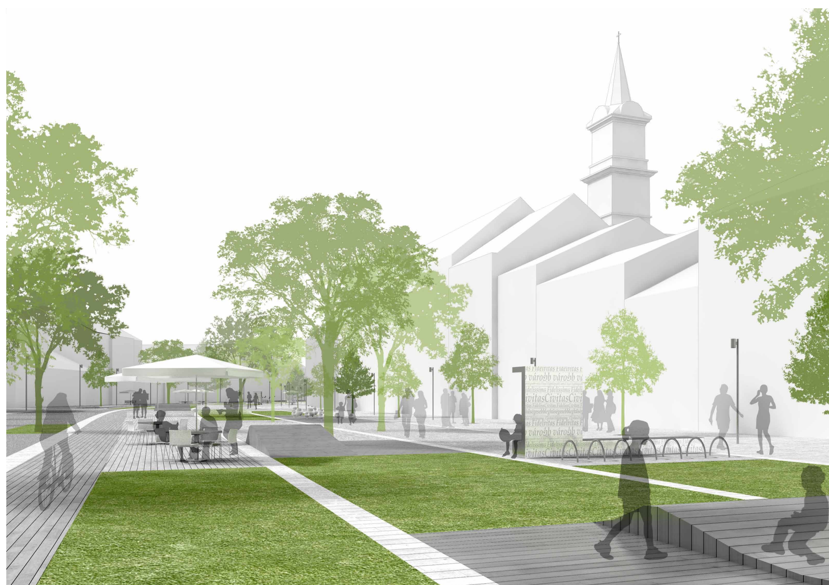
Távlati kép a megújított Várkerület egy jellemző részéről. A tér szerkezeti vonalait, mint „kották” olyan alaphálózat biztosítanak, amelyben minden ponton más és más történik, mégis egységes koncepció mentén.