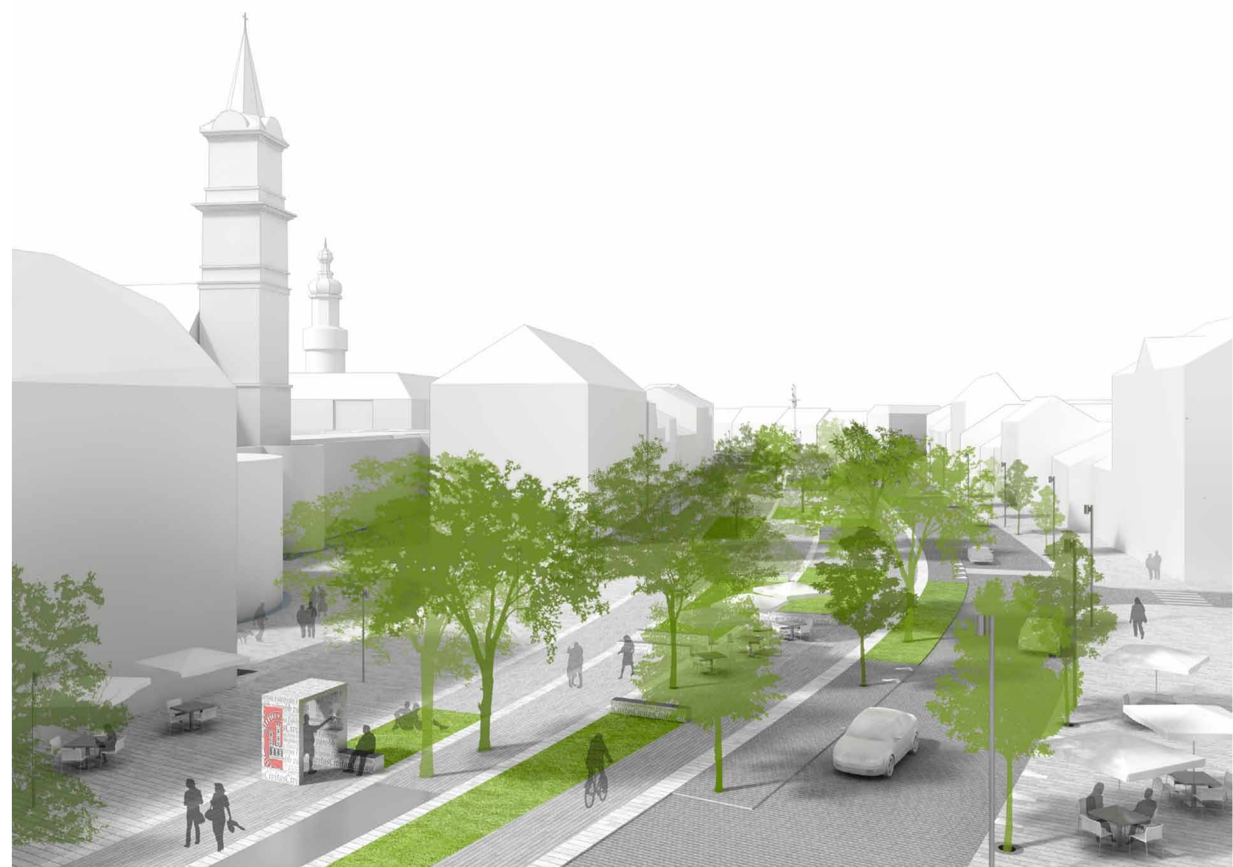
Madártávlati kép a Bástya térhez kapcsolódó Várkerület-szakaszról.