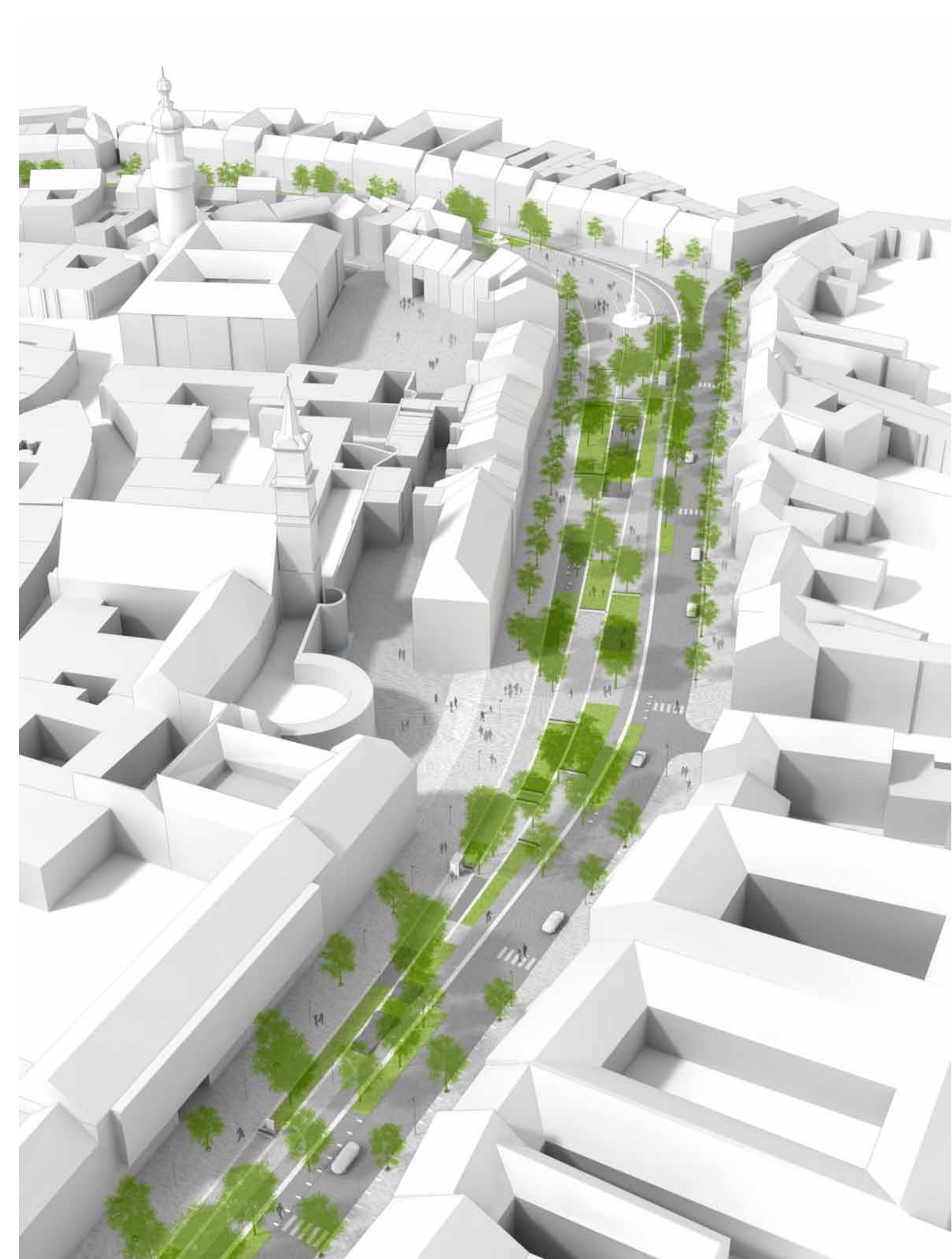
Madártávlati kép a Várkerület-koncepcióról: hosszirányú lendület és a keresztirányú változatosság kettőssége.