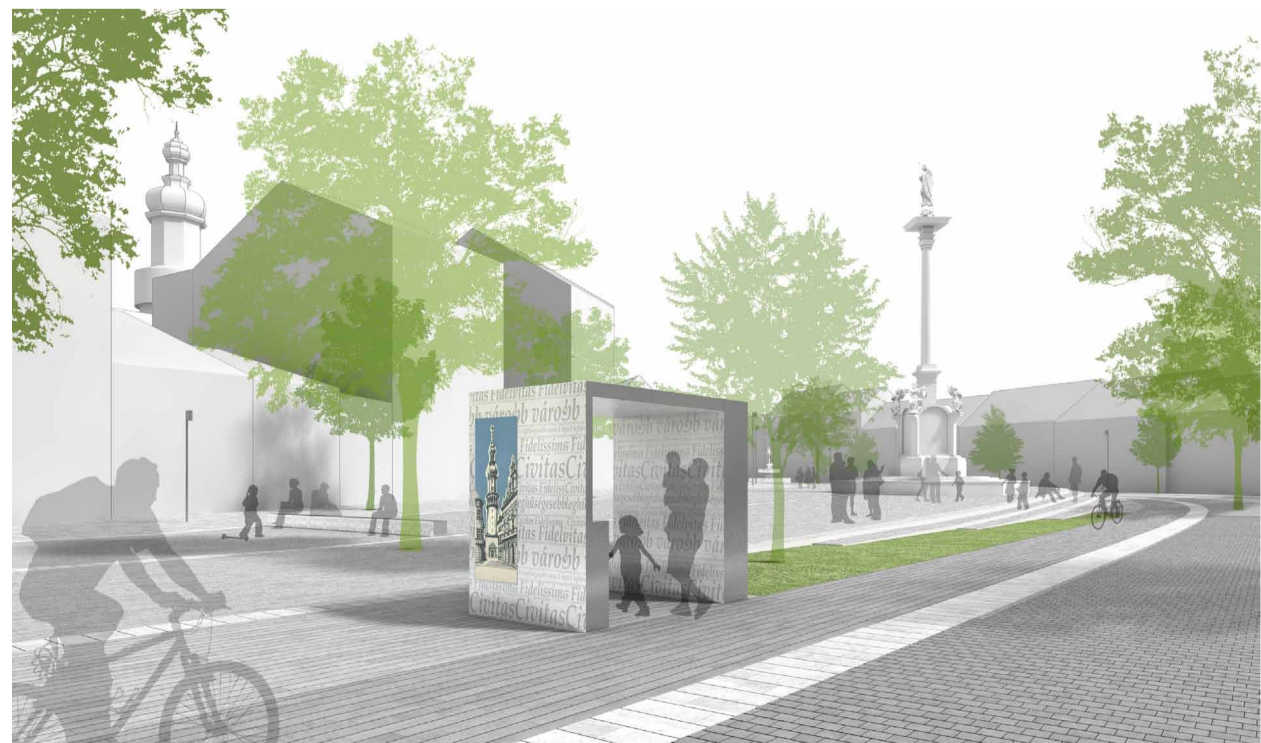
Látvány az új rendezvényter felé nézve, előtérben egy közterületi pavilon (info-pont), háttérben a Mária-oszlop és a Hűség Kútja

Olyan utcabútor-családot javasol a tervünk, amely egységes, új minőséget vihet a Várkerület megjelenésébe. A bútorcsalád lényege, hogy elemei, fajtái egymásból következnek, és későbbi igény esetén is könnyedén bővíthető a választék. Padok, információs paravánok, kisebb info-pontok, pavilonok, kerékpártárolók és mobil, alkalmanként összerakható vásári- és fesztiválpavilonok mind-mind azonos családhoz tartoznak. Fémburkolatú, világos és elegáns felületek, amelyeken a „civitas fidelissima” felirat jelenik meg különböző nyelvekre lefordítva, mint identitás adó, narratív gesztus. A közterületi bútorok egyszerűek, inkább tárgyszerű elemként jelennek meg a téren.