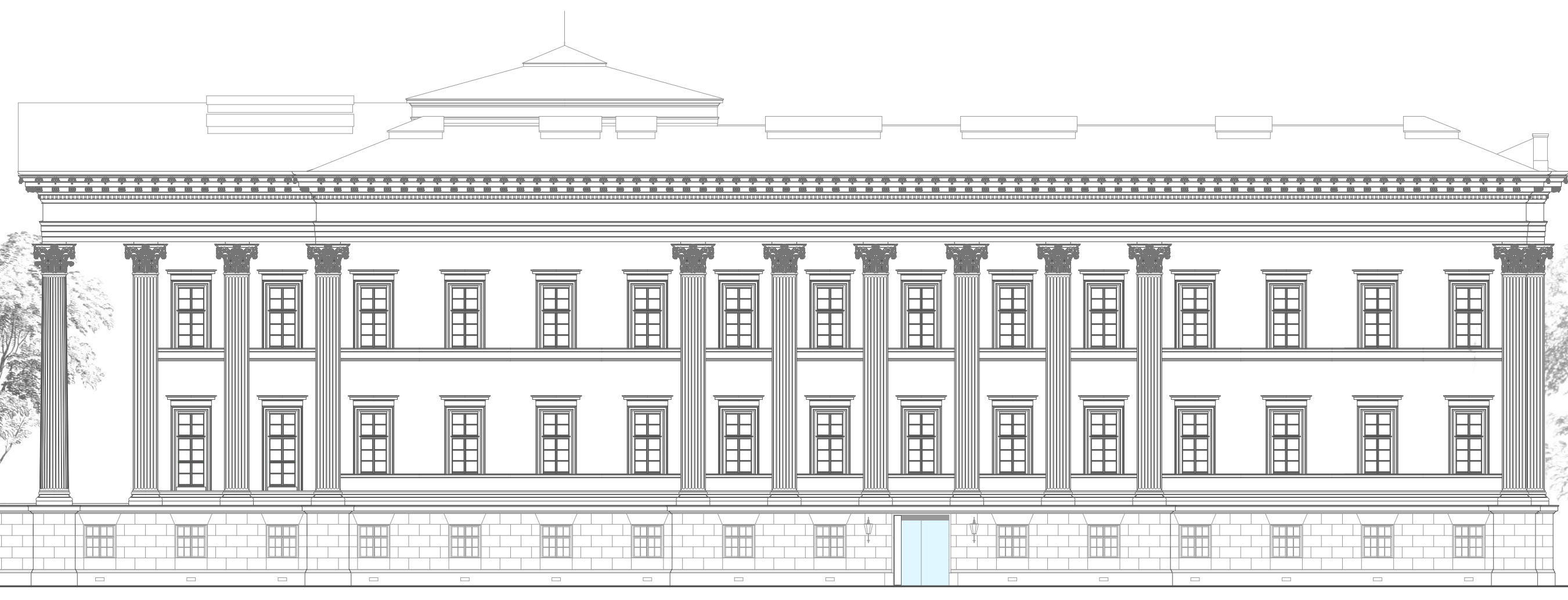
Déli homlokzat m=1:250