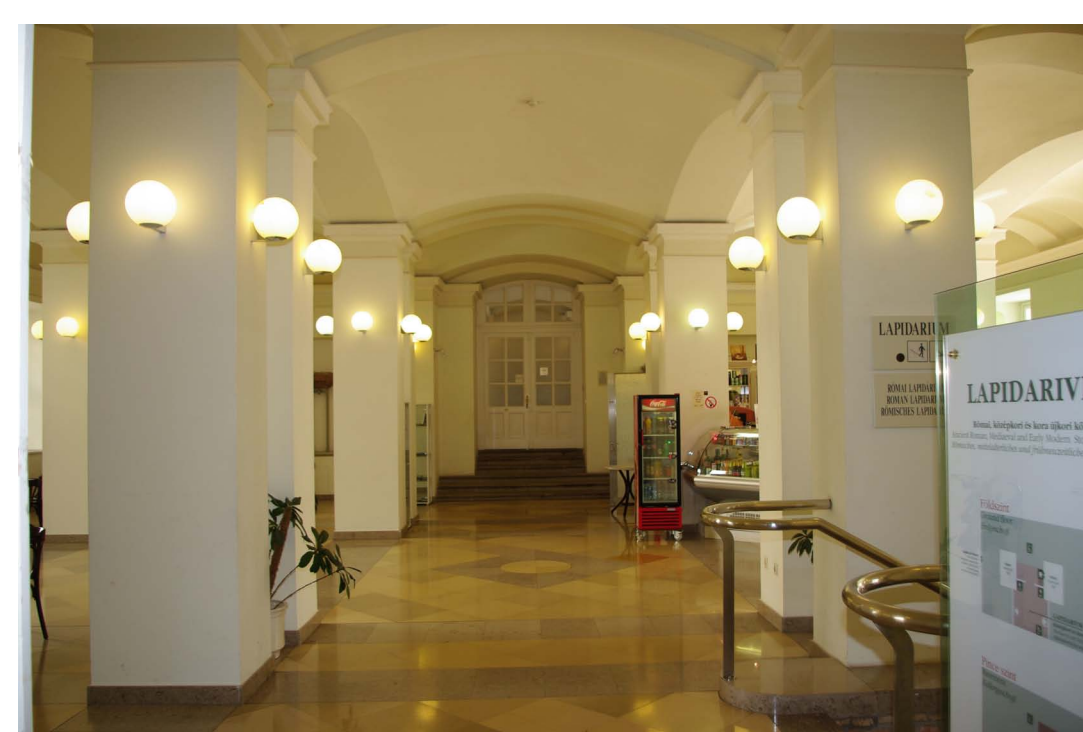
a jelenlegi bűfé zavaros vizuális világa