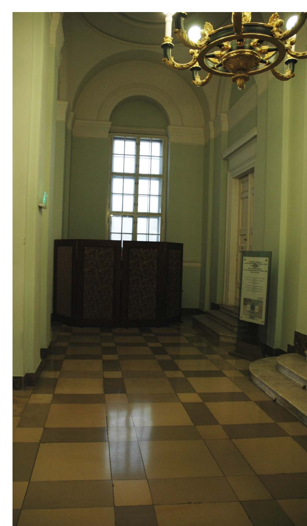
mellőzött térrész a főlépcső előtt