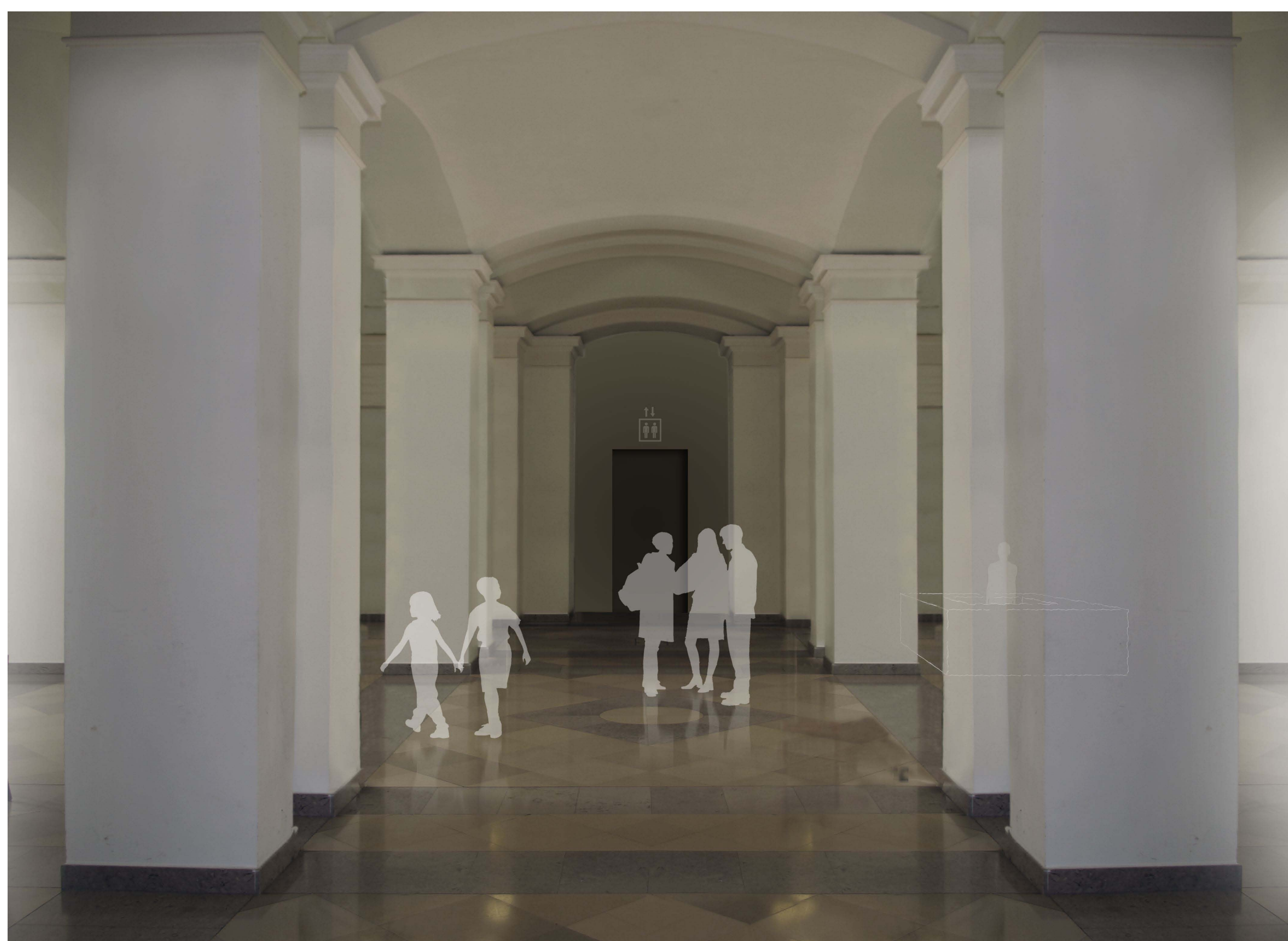
a múzeum geometriai középpontja közösségforgalmi csomópont