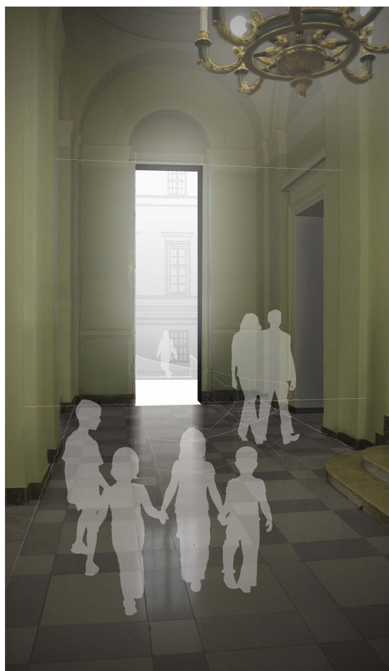
az új lépcső bekapcsolódik a Pollack- féle reprezentatív térsorba