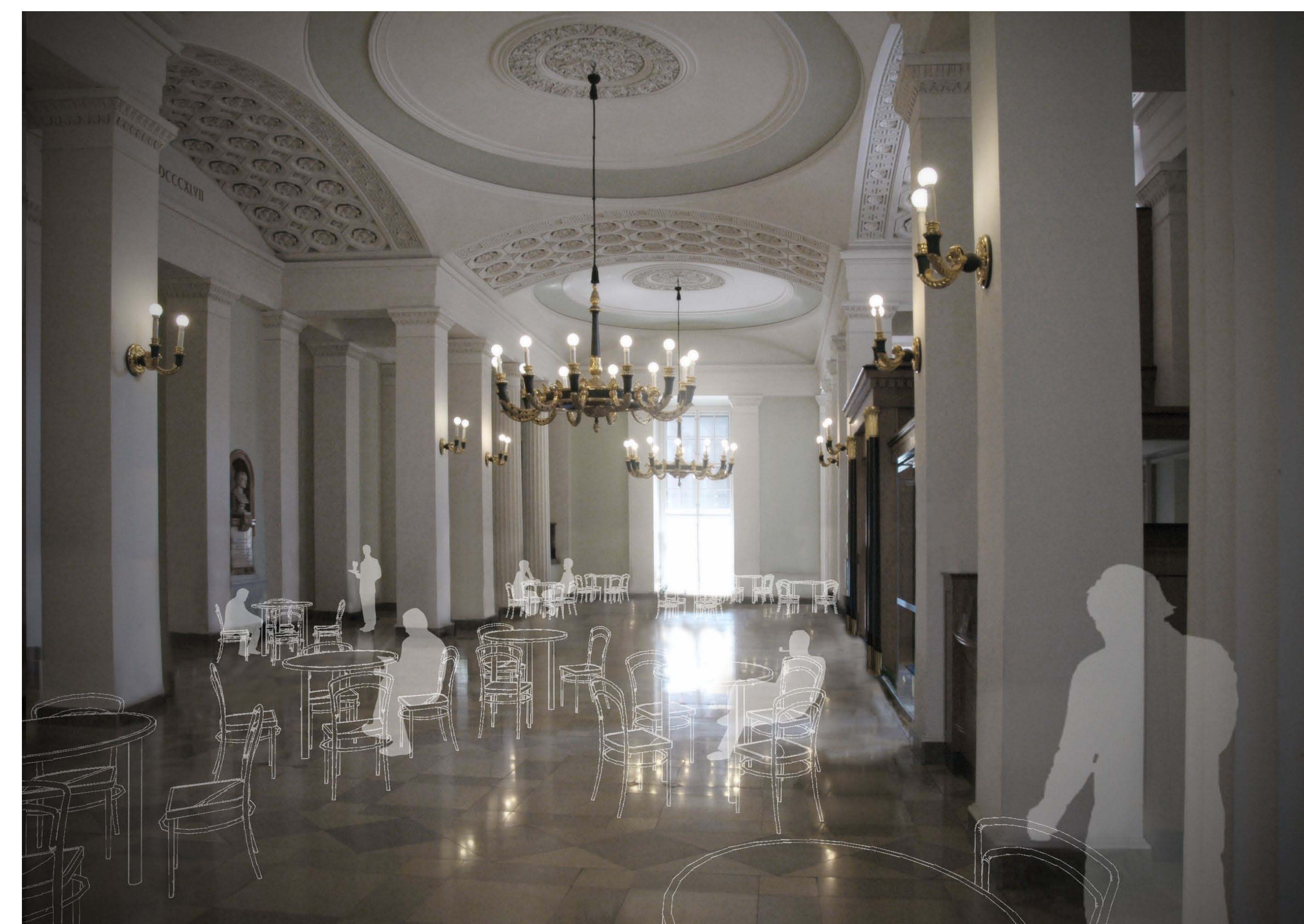
az előcsarnok exkluzív kávézóvá alakul át