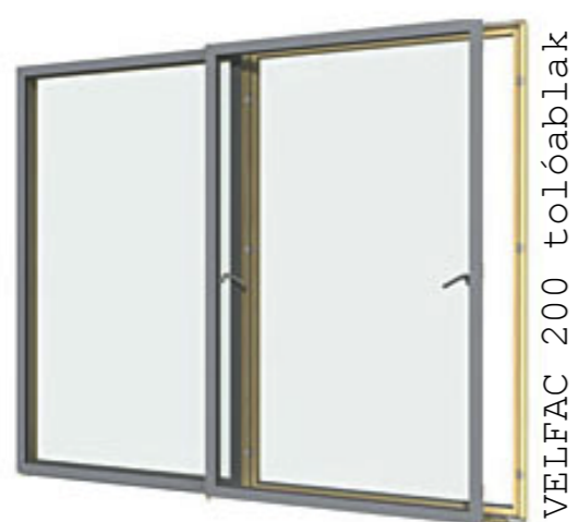
VELFAC 200 tolóablak