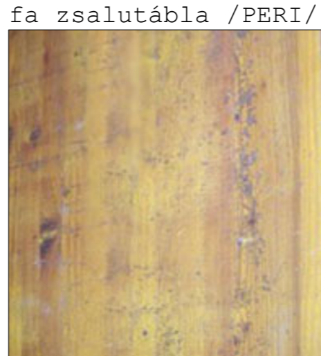
fa zsalutábla /PERI/