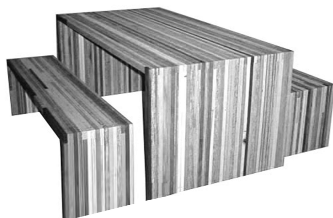
hulladék fából préselt és ragasztott bútort /fehérre festve