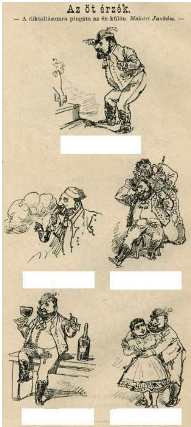
Borsszem Jankó, 1882. január 15.