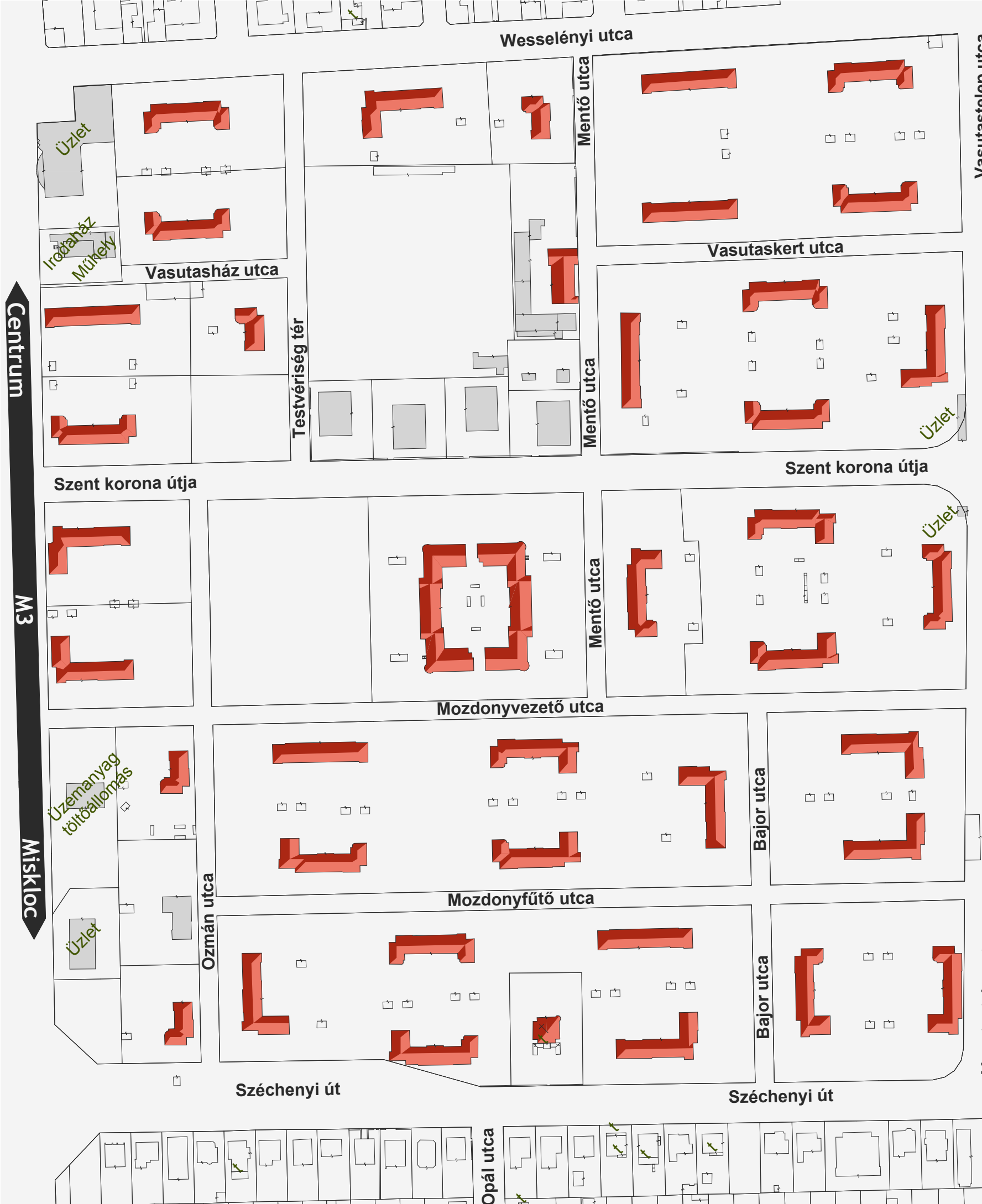
TETŐIDOM VIZSGÁLAT M=1:2000

Magas Lapos A MÁV telepen jellemzően 2 szintes magastetős épületek vannak, kivétel ez alól a 3 szintes tisztai ház. Az 1970-es években épült tömbházak, illetve az ez után épült M3-as autópálya mellett lévő épületek nagyrésze már lapostetős. A területen egyedi építménymagassággal rendelkezik a Széchényi úton található Református templom. A terület peremén az M3-as mellett kialakítható lenne egy zártabb beépítés, magasabb (akár 3 szintes) épületekkel és nem lakó funkciókkal. Ezáltal csökkentve a zajterhelést a belső lakott területeken.