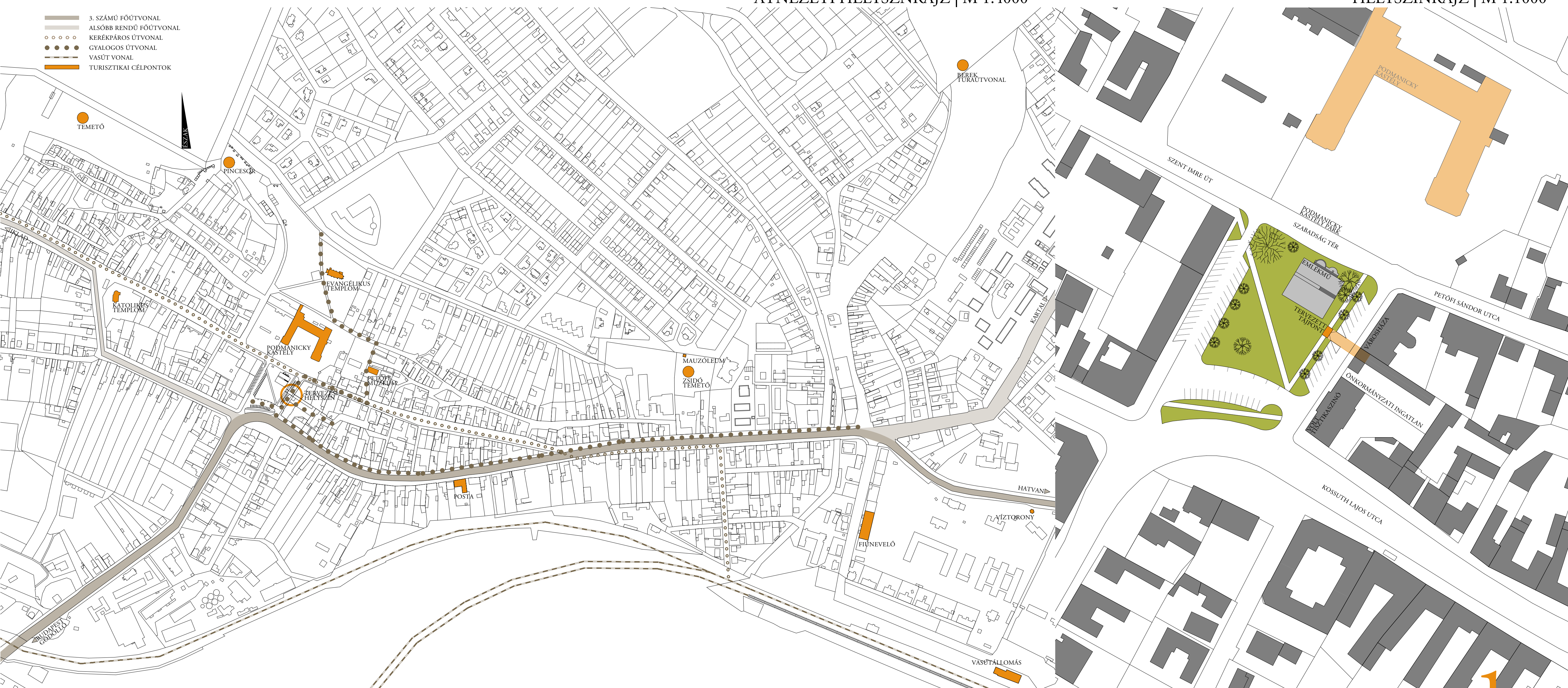
HELYSZÍNRAJZ | M 1:1000