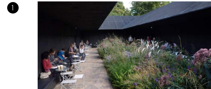
1 A belső udvarnak fontos a változatosága. Az udvar közepén egy lombhullató fa található. A fa körül pedig magasra növő színes virágok vannak, melyek a különböző hónapokban más színekkel teszik változatosabbá ezt a teret.