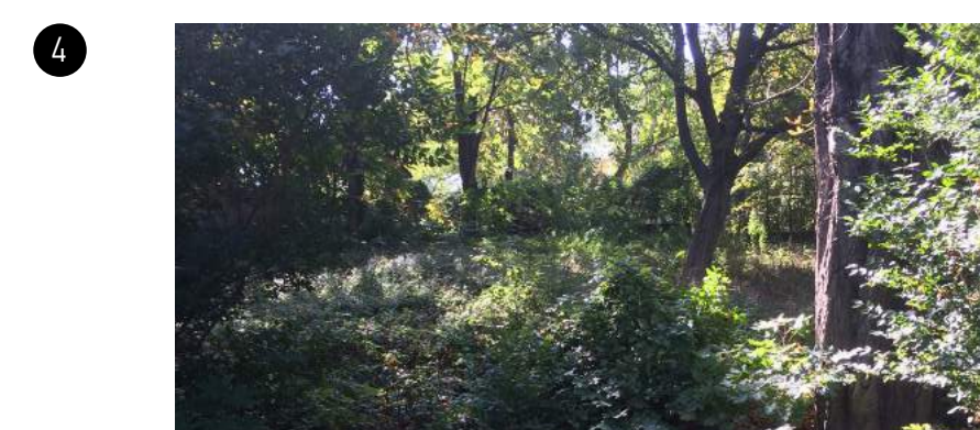
4 A kert szélénél az eredeti növényzet van meghagyva. Nemcsak a nagy öreg fák, de a buja aljnövényzet is. Ez a terület puffer térként viselkedik az épület és a szomszédos területek között.