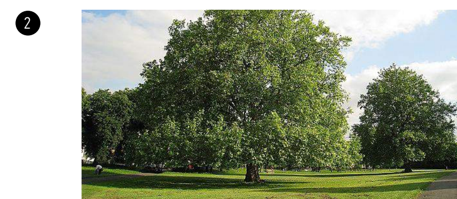
2 Az udvar és az ösvény közötti sávban a meglévő fák dominálnak. Itt az aljnövényzet el lett távolítva, hogy tiszta kilátás legyen az ide nyíló helyiségekből.