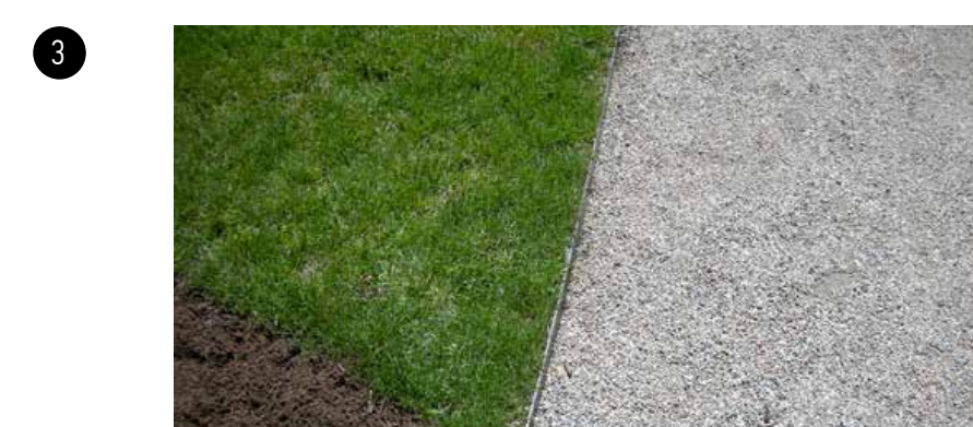
3 Az ösvény körbevezet a kerten. A fedett-nyitott tértől indul és a kerten körbeveve a főbejáratnál végződik. A kert északnyugati sarkánál, egy kertkapuval csatlakozik az utcához, mely a kertnek a másodlagos bejárata.