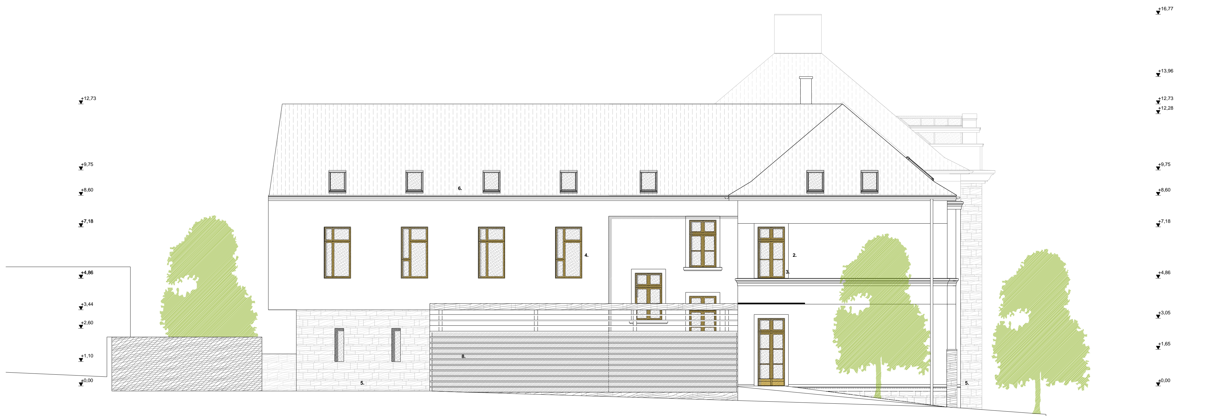
Nyugati homlokzat M 1:100