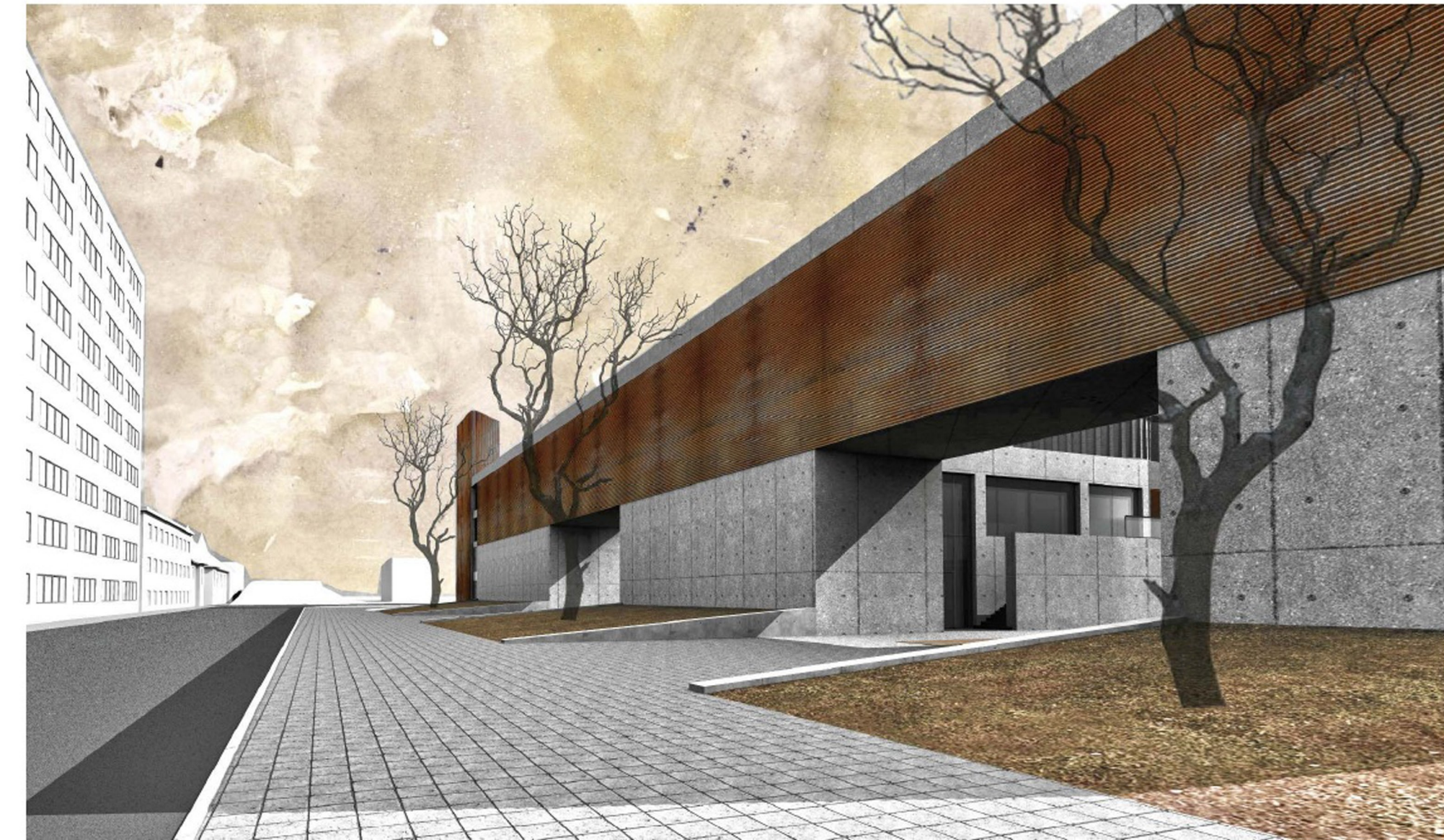
ÉSZAKI HOMLOKZAT NÉZETE