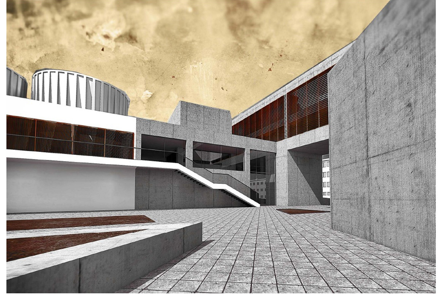
MOZI FOGADÓÉPÜLETE A KONFERENCIAKÖZPONT FELŐL