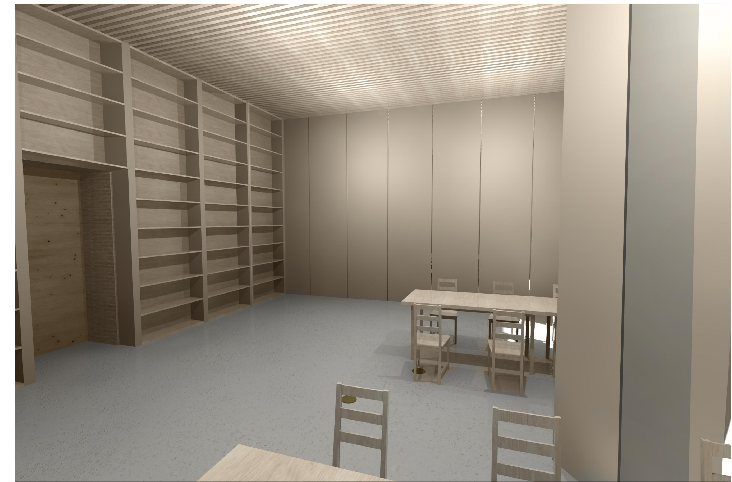
LÁTVÁNYTERV- SEKCIONÁLHATÓ SZERZETESI MUNKATEREM