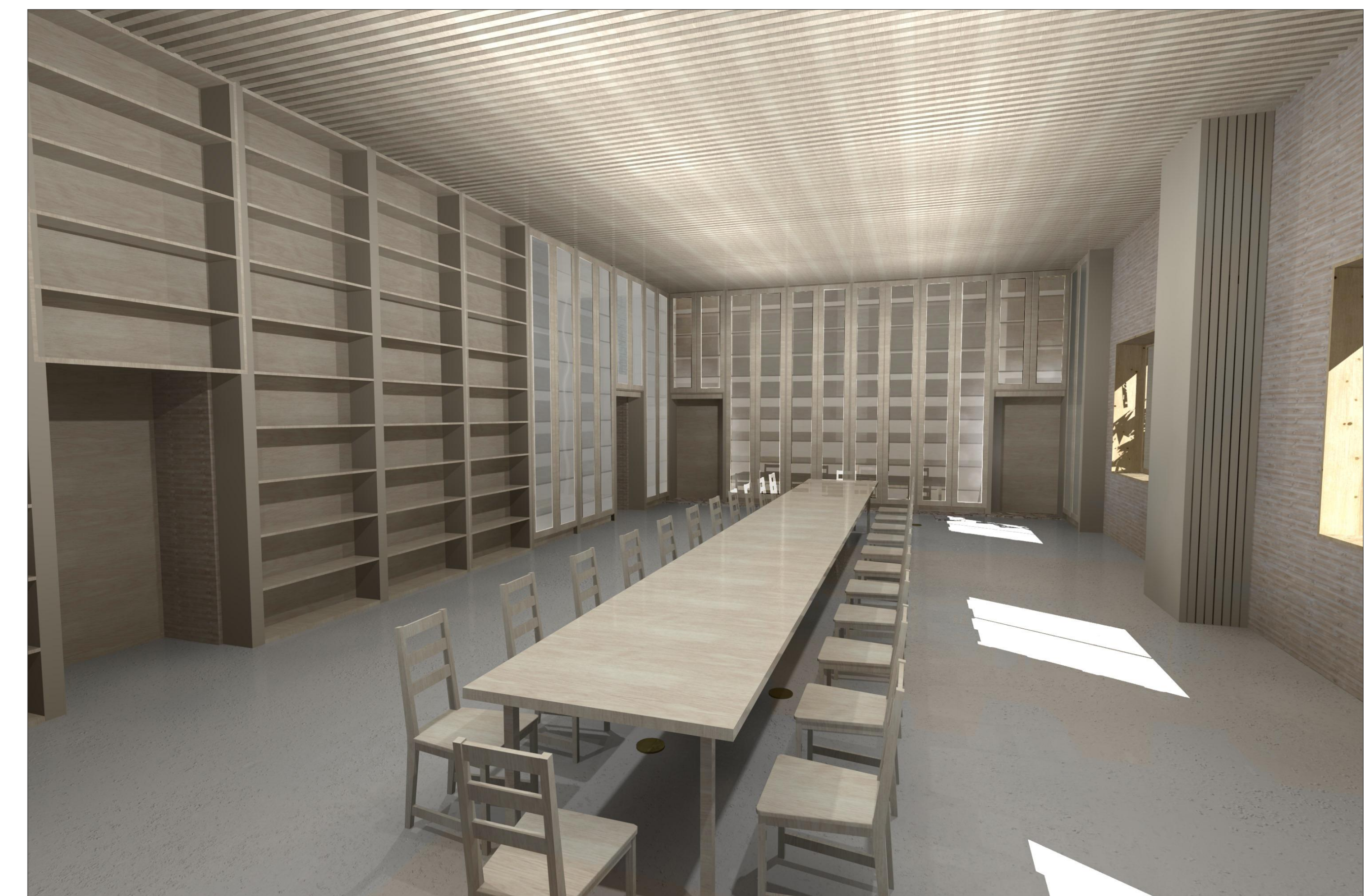
LÁTVÁNYTERV- KÁPTALANTEREM: MUNKATEREM ÉS ÉTKEZŐ EGYBENYITVA