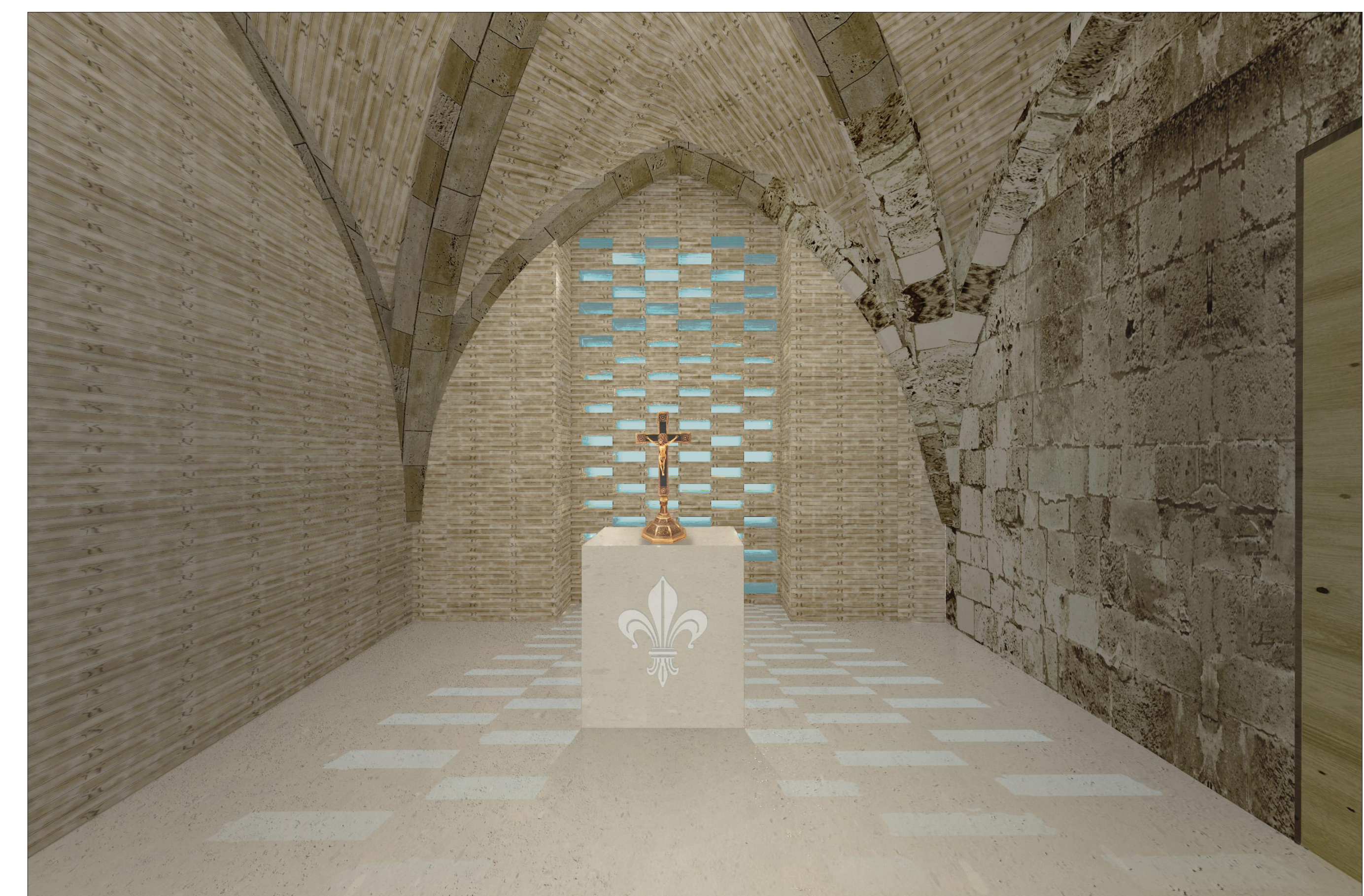
LÁTVÁNYTERV- REKONSTRUÁLT PRÉPOSTI KÁPOLNA