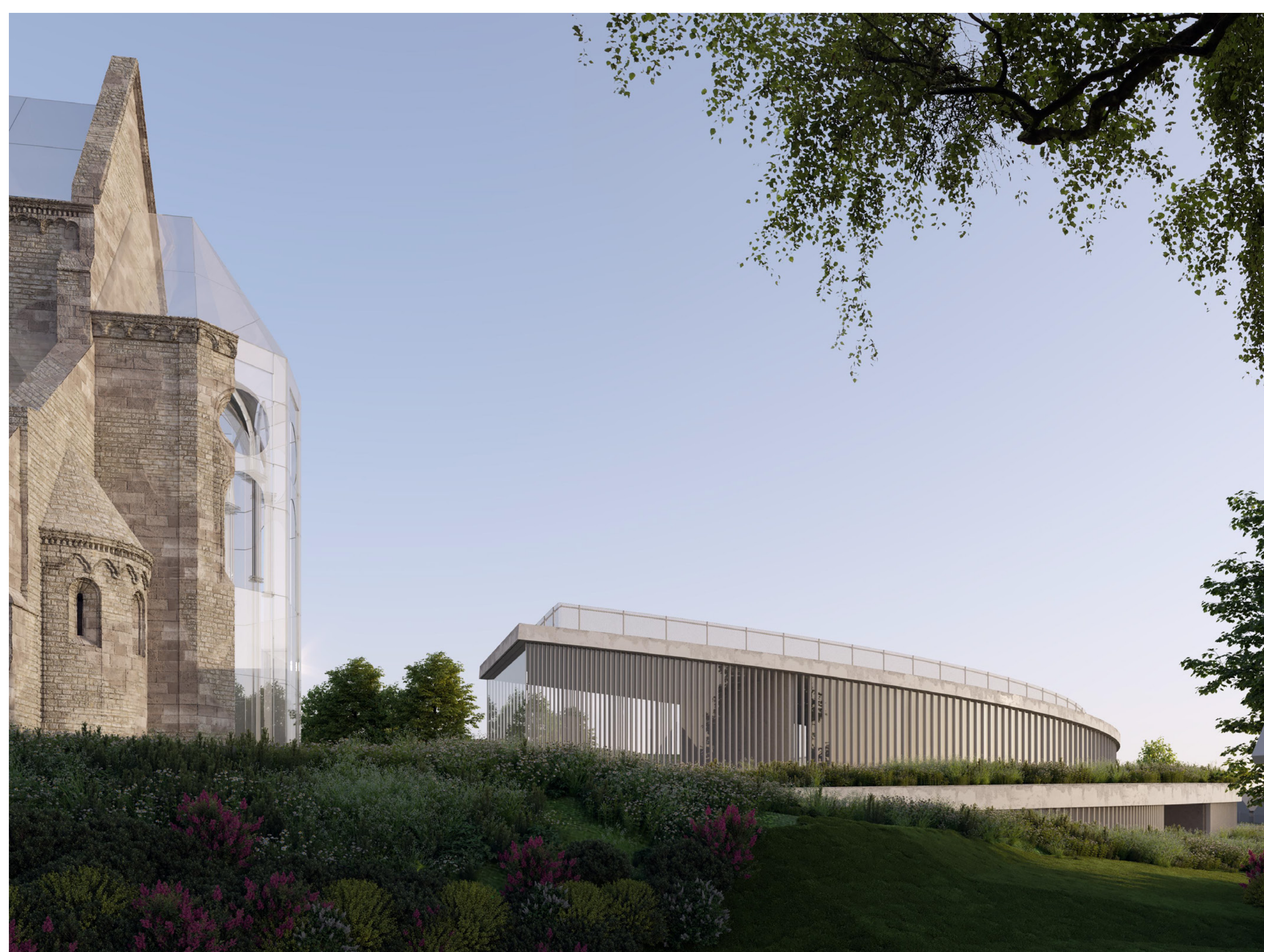
az apszis és a kápolna kapcsolata