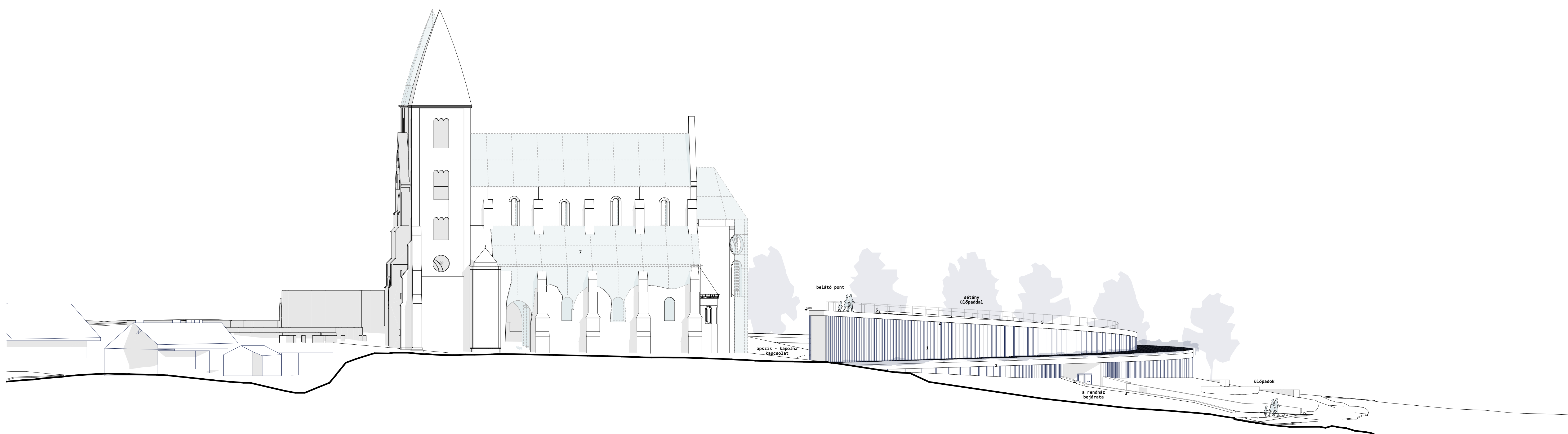
Délkeleti homlokzat m = 1:200