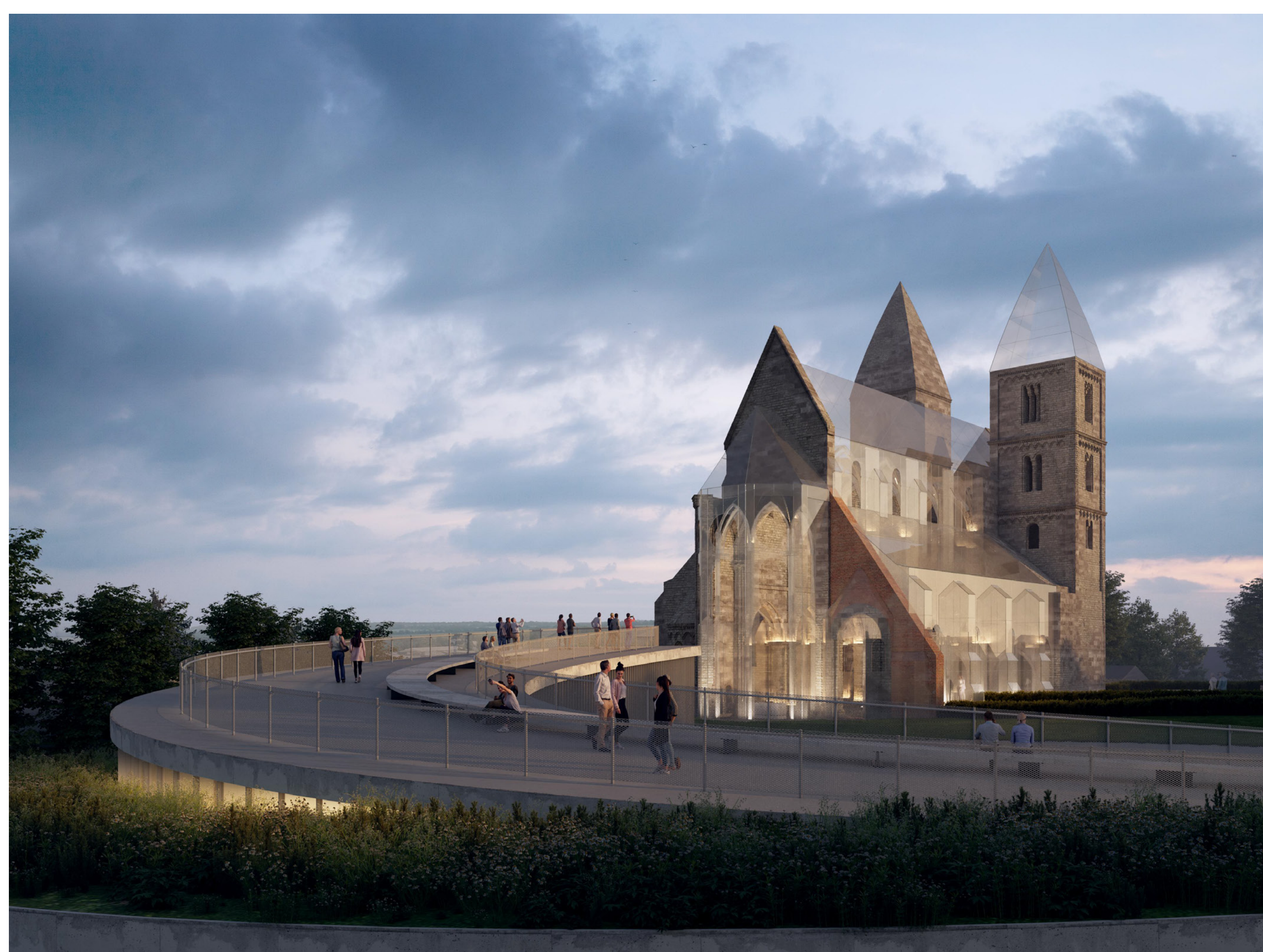
kiemelt belató egy újabb, izgalmas szemléletmóddért