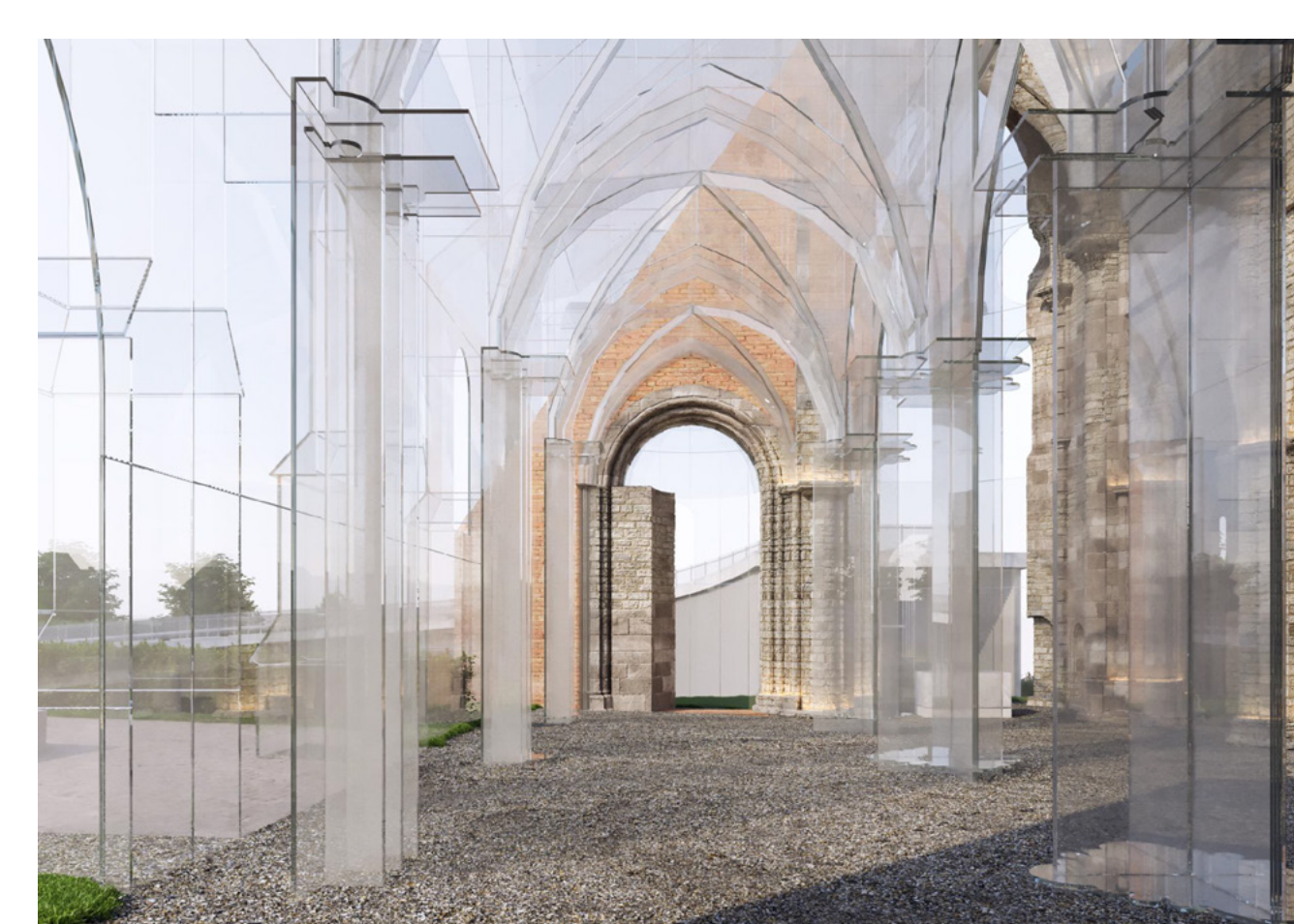
az újjáépített oldalhajó