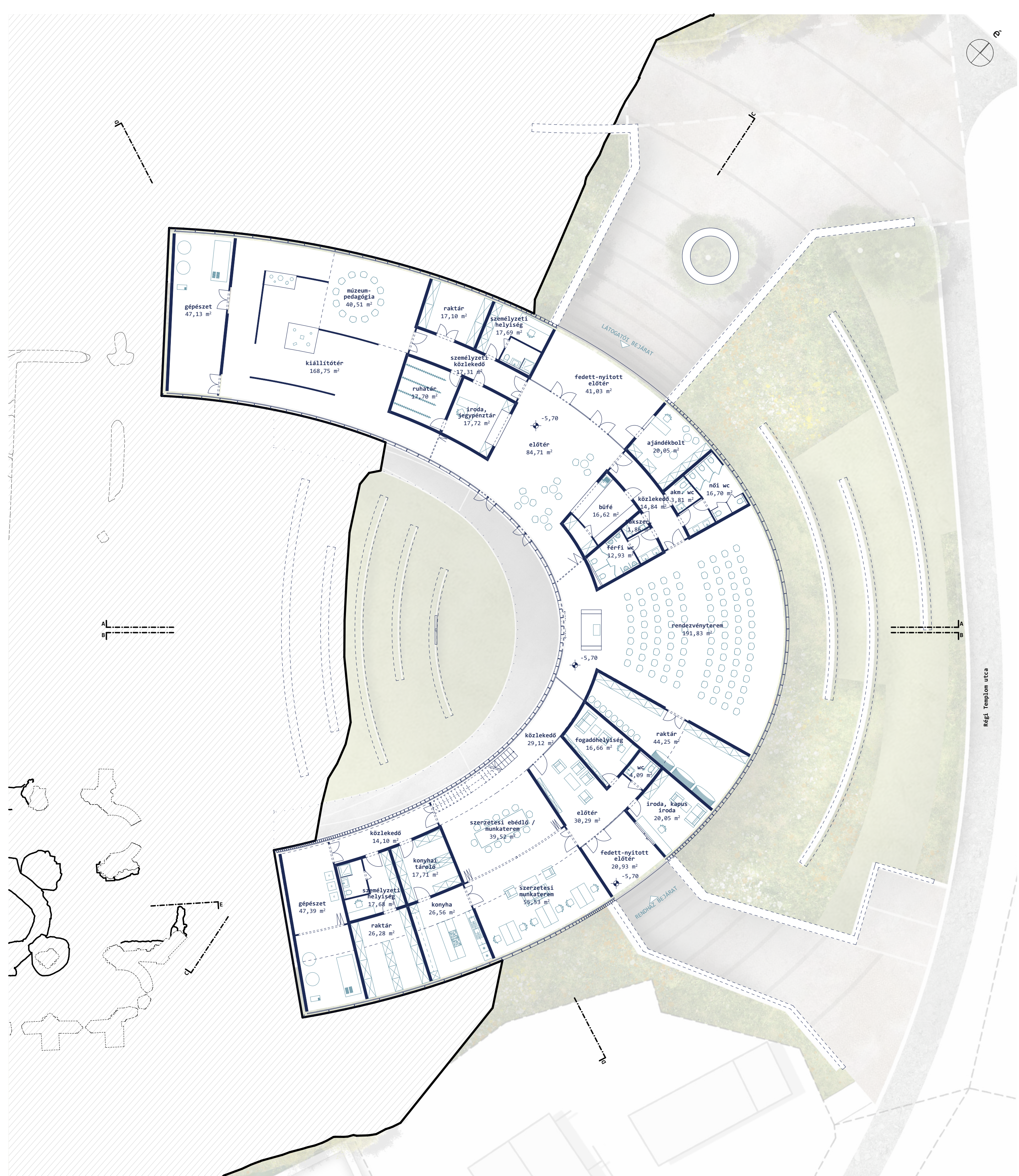
földszinti alaprajz m = 1:200