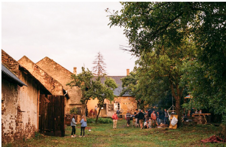
AT x Építészeti x Kővágóörs I. fotó: pongor Soma, 2018

KŐVÁGÓÖRSÖN 2018 óta szervezünk kulturális eseményeket és táborokat, egyesületünk 2020 februárjában alakult. Többféle művészeti és szakmai program kötődik a helyszínhez, ezek közt az építészeti tábor rendelkezik a legrégebbi hagyományokkal. Az alkotótábor helyszínén asztalos- és grafikai műhely, valamint analóg fotólabor is a táborozók rendelkezésére áll, így a manualitás nagy hangsúlyt kap a workshopokon.