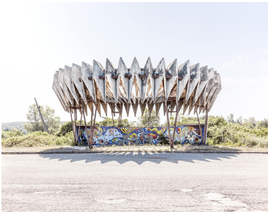
Christopher Herwig, courtesy of FUEL. (From the film and Vol 1 of Soviet Bus Stops published by FUEL)

A KŐVÁGÓÖRS ALKOTÓTÁBOR EGYESÜLET 2025-ben, a nyári építészeti tábor megrendezése mellett a tavaszi szemeszter időszakában egy nyílt, titkos ötletpályázatot is kiír.