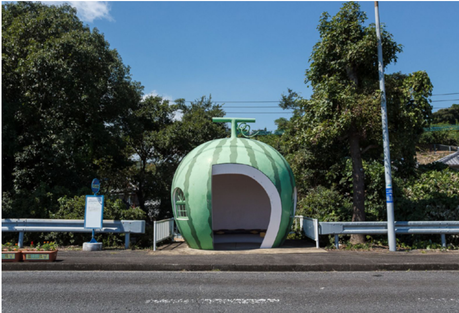
A fruit-shaped bus stop in Konagai, Japan.