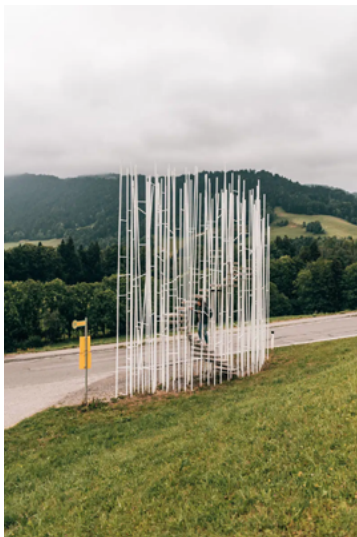
Brändén bus stop by Sou Fujimoto