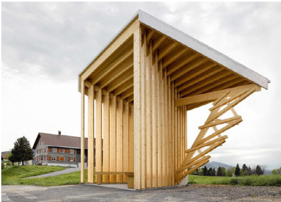
Glatzege bus stop by Wang Shu and Lu Wenyu of Amateur Architecture Studio

A kérdéseket az alábbi címre várjuk: PALYAZAT@KOVAGOORSALKOTOTABOR.HU