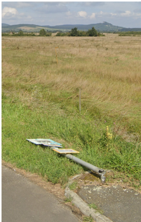
AT x Építészeti x Kővágórs. I. fotó: pongor Soma, 2018