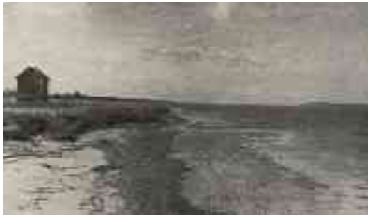
1. A Somogyi lapos homokpart eredeti képe 1942-ben fürdőházzal. (Forrás: Entz - Sebestyén (1942): A Balaton élete )