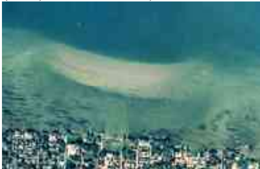
2. Szigetépülés a mederben: a betonpartok kedvezőtlen hatásai miatt.