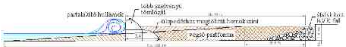
3. Az építés menete: A több szelvényű tömlőgát és a betonpart közé feltölteni a homokot, a kellő ülepedés után a gát eltávolítható és a hullámok kialakítják a természetes partot.