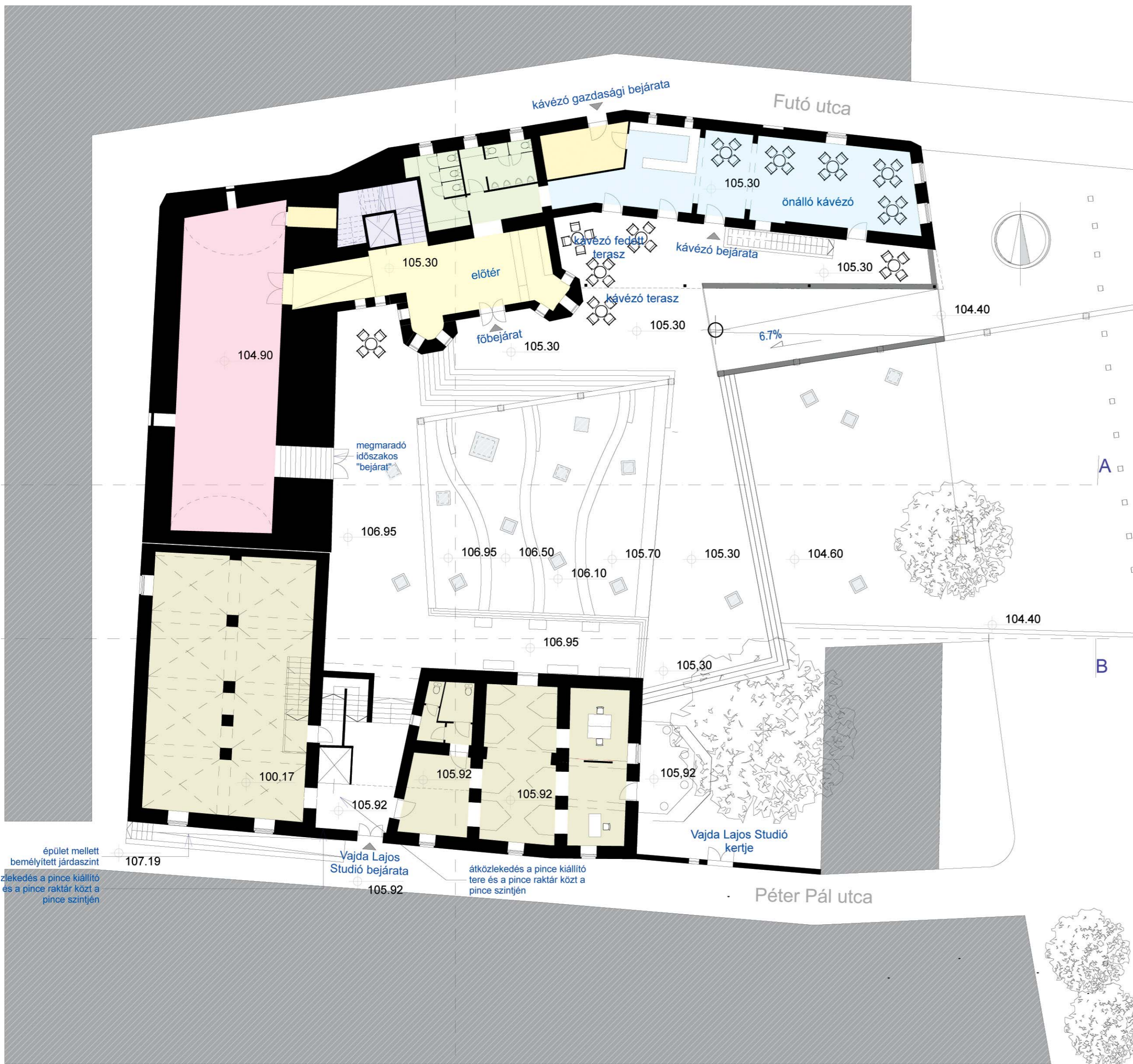
Alagsori alaprajz (105.92; 105.30)