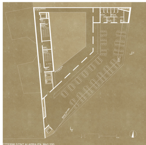
ÉTTEREM SZINT ALAPRAJZA M=1:200

TETŐÉTEREM A főbejárat mellett induló látványlift közvetlenül az önálló tetőéterembe visz fel. A szállóvendégek a vendéglifttekkel és lépcsővel érhetik el a szintet. A gazdasági lift és lépcső szolgálja ki a tetőéttermet. Az étteremnek önálló vizesblokkja van. Az étterem teljes homlokzata üvegfal, zavartalan dunai panoráma. Végigfutó teraszszáv. A teraszszávrá nemcsak egy-egy helyen, hanem a végig eltolható üvegfal bármely pontján, minden egyes asztalhoz kijuthatunk. Üveggé vált déli sarok, városdéli panoráma, kilátás a Palotára.