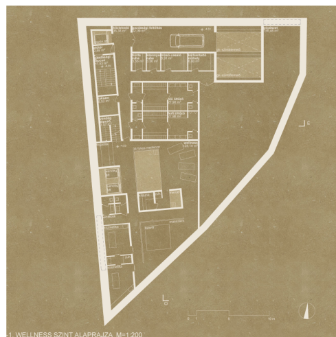
1. WELLNESS SZINT ALAPRAJZA. M=1:200

-2. PARKOLÓSZINT Érkezőkor a vendég átadja az autót, a személyzet viszi le az autólifttel a parkolószintre. A vendég kérésére a személyzet hozza ki. Parkolás helytakarékos emelőtálcás megoldással. A fennmaradó területen raktár és gépészet.