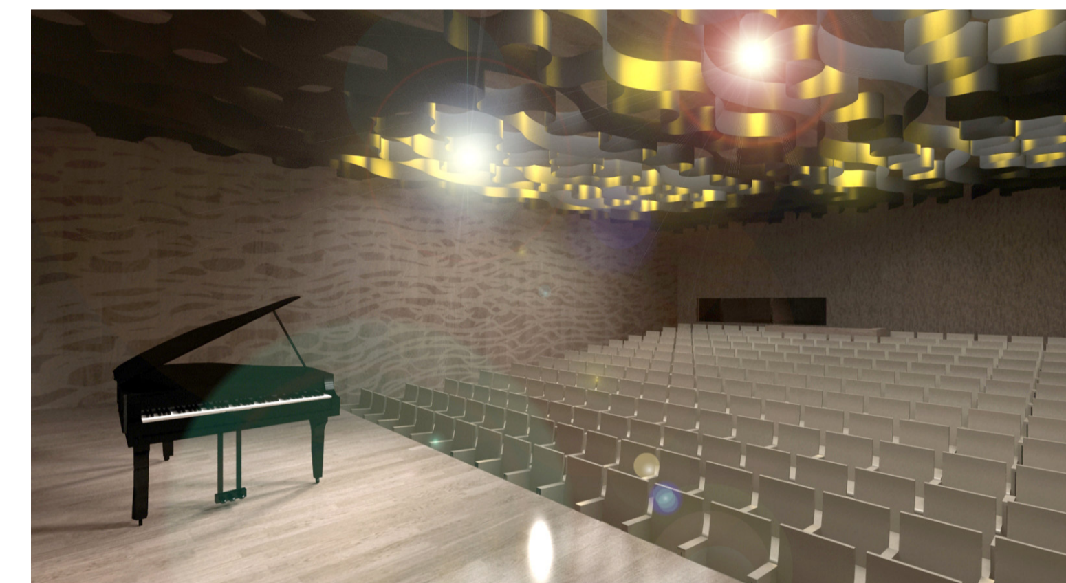
az előadóterem nézőtere a színpad felől nézve