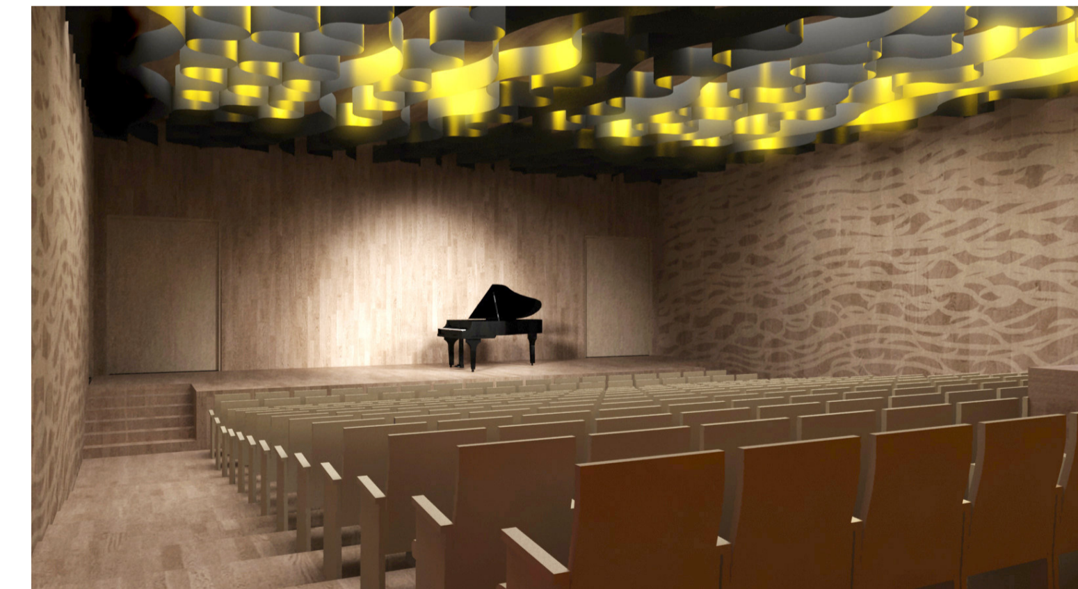
az előadóterem látványra 220 néző befogadására alkalmas nézőtér elrendezéssel