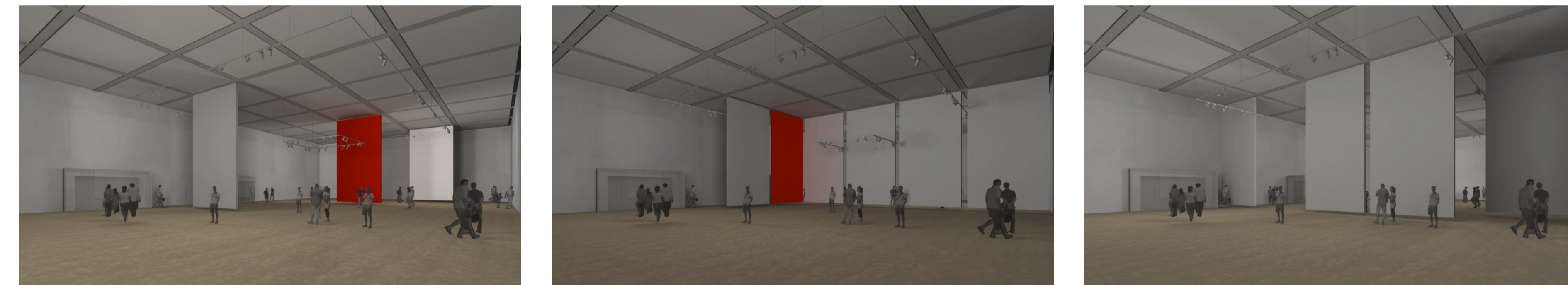
ÓRIÁSKIÁLLÍTÁS NAGY ÉS KICSI KIÁLLÍTÁS 2 KÖZEPES KIÁLLÍTÁS