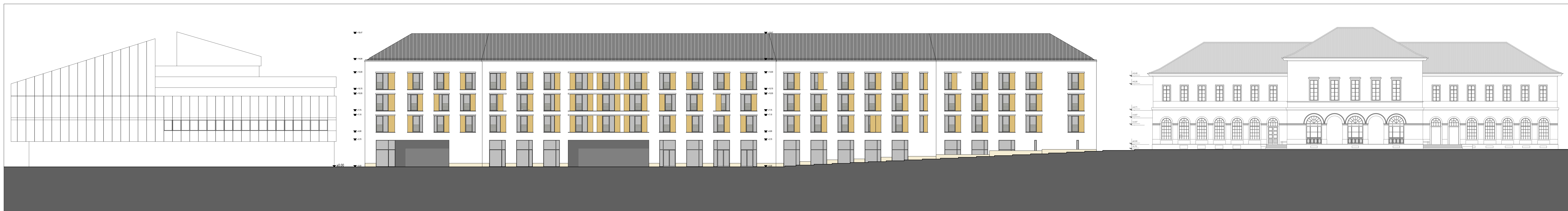
KELETI (UTCAI) HOMLOKZAT