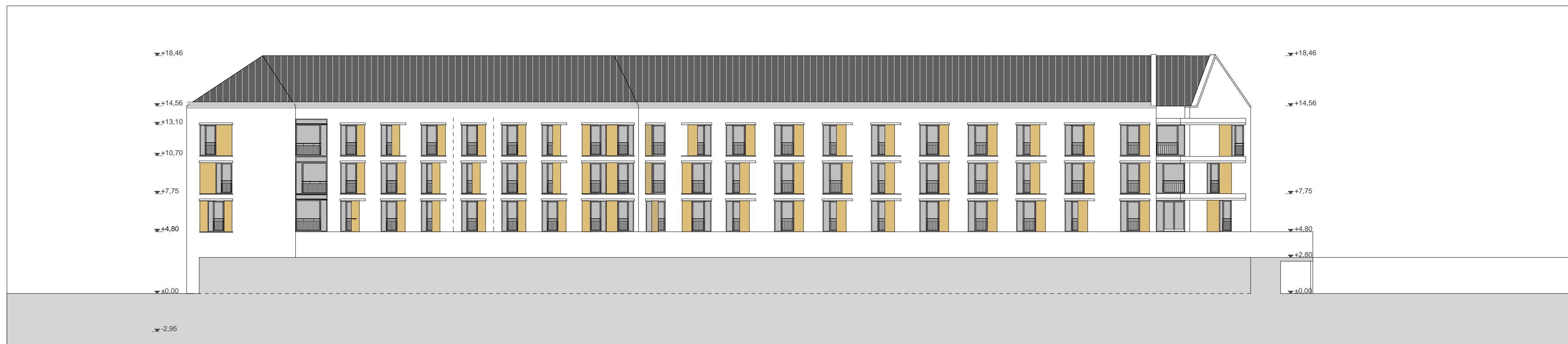
ÉSZAKI (STRAND FELÉ NÉZŐ) HOMLOKZAT