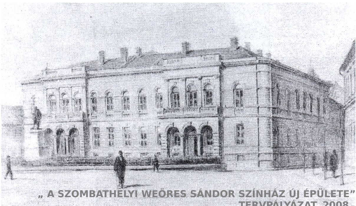
„ A SZOMBATHÉLYI WEÖRES SÁNDOR SZÍNHÁZ ÚJ ÉPÜLETE” TERVPÁLYÁZAT, 2008.