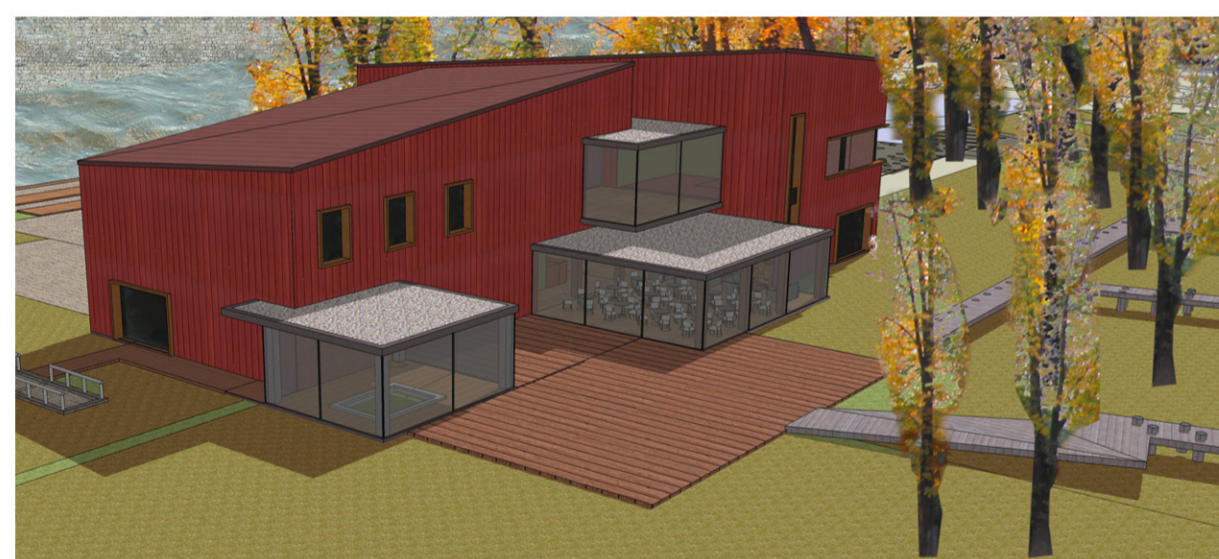
A KÉT ÉPÜLETRÉSzt ÖSSZEKÖTŐ ÜVEGKUBUSOK