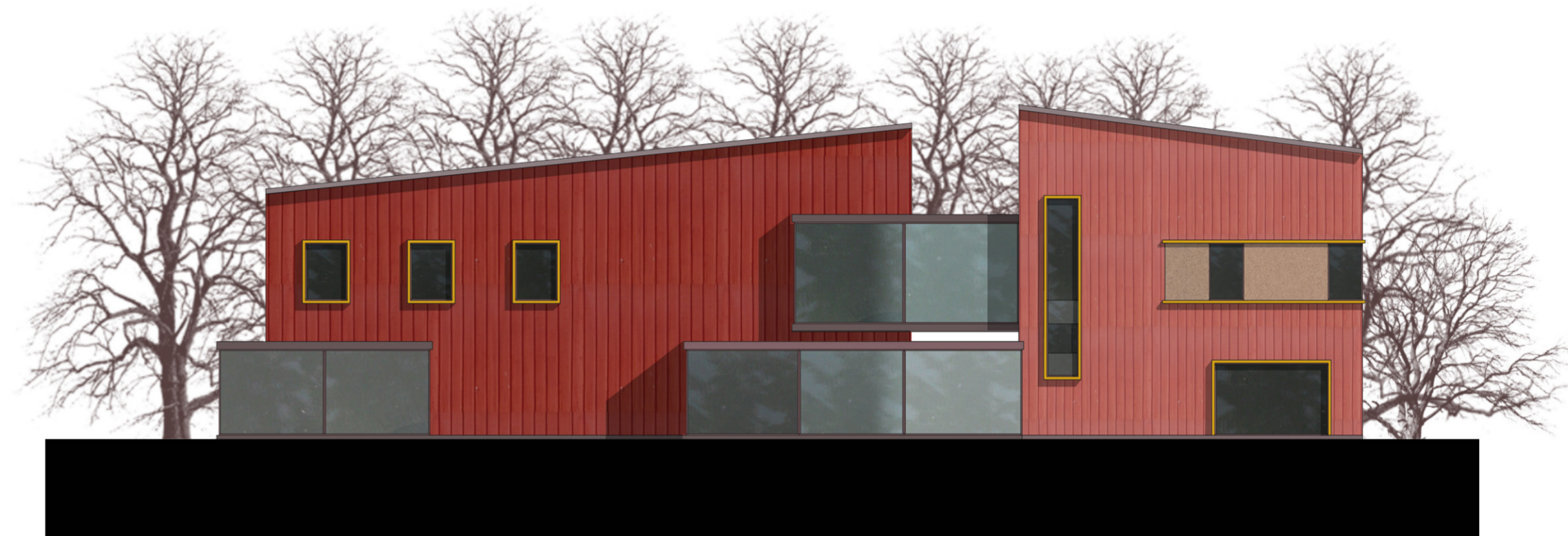
ÉSZAK-NYUGATI HOMLOKZAT M 1:200