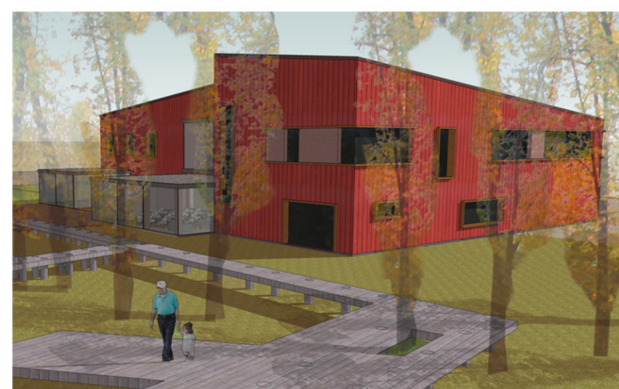
CSÓNAKHÁZ A STÉGEK FELŐL