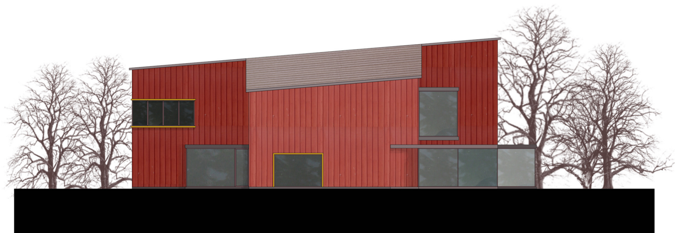
ÉSZAK-KELETI HOMLOKZAT M 1:200