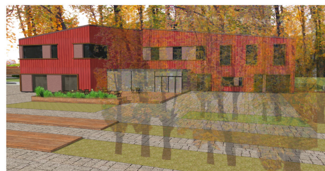
A CSÓNAKHÁZ A PARTI SÉTÁNY FELŐL