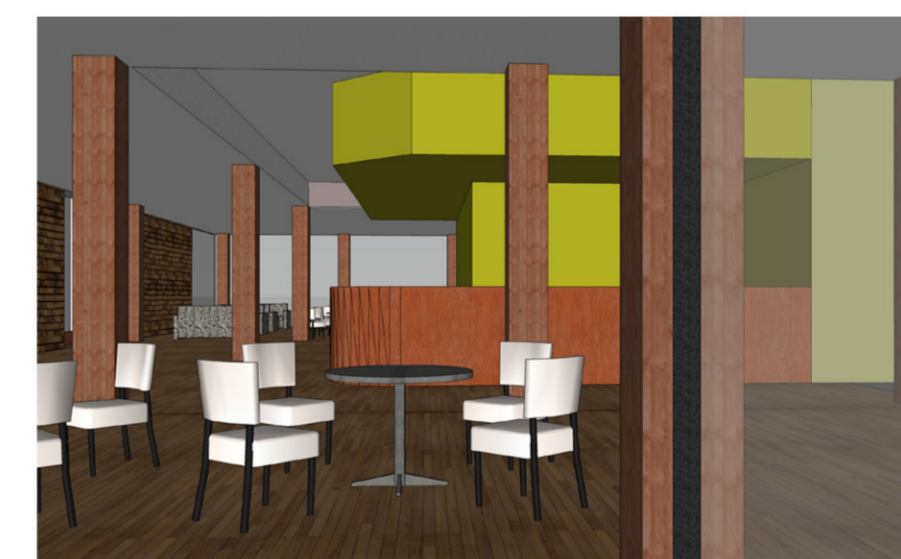
A KÁVÉZÓ ÉS A RECEPCIÓ