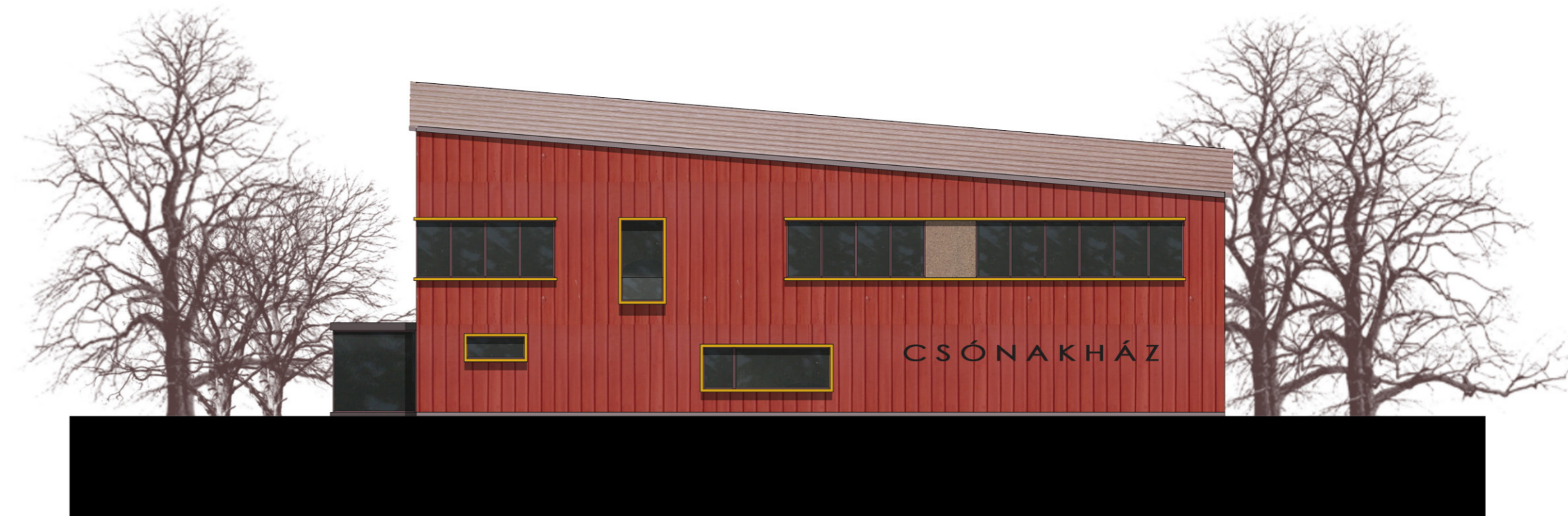
DÉL-NYUGATI HOMLOKZAT M 1:200