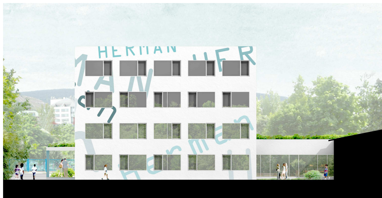
DÉLI HOMLOKZAT M1:200