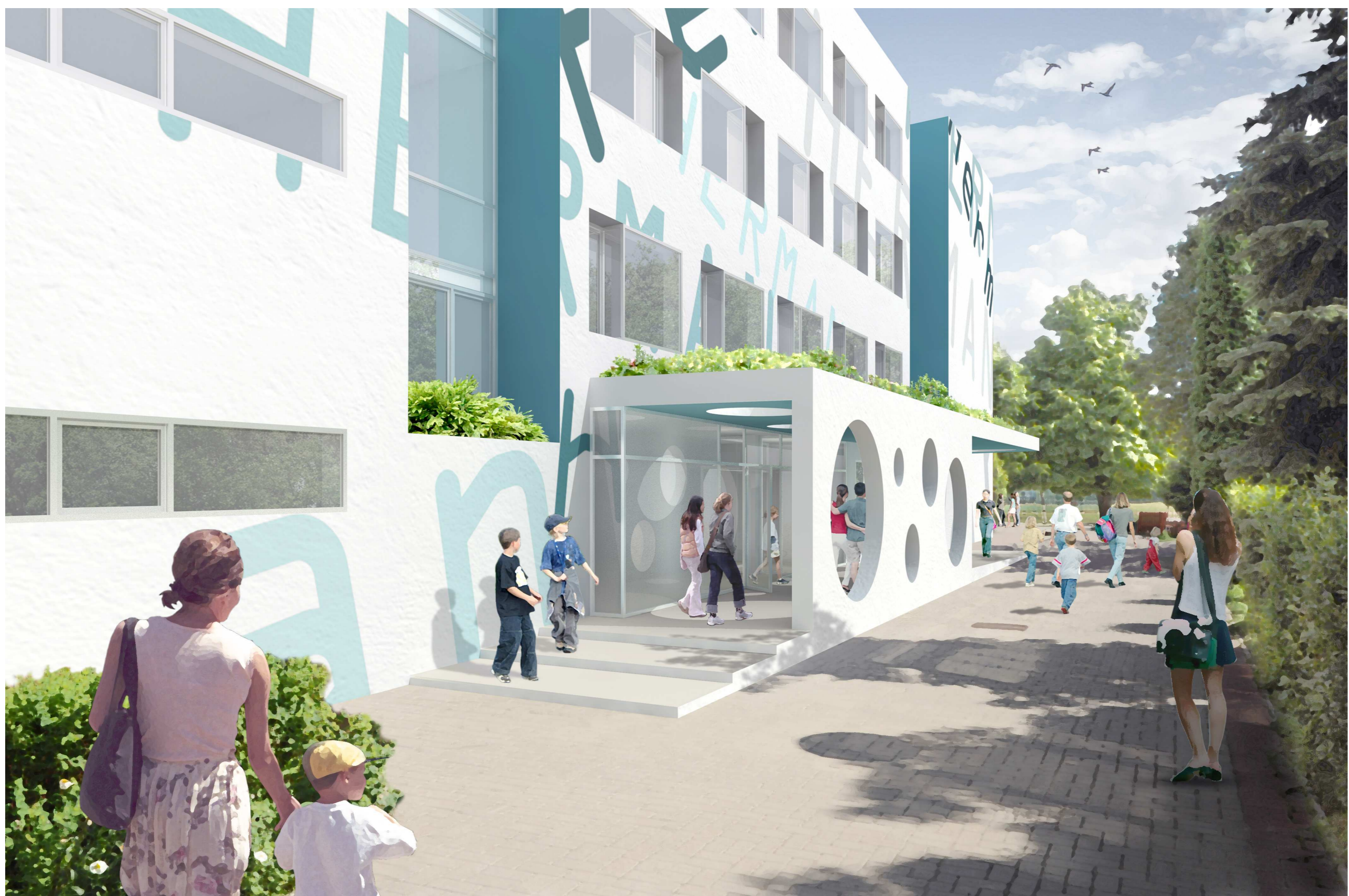
A FŐBEJÁRAT NÉZETE

Az új főbejárat kialakításánál azt tartottuk szem előtt, hogy a méltó reprezentációt biztosítson a megújított középületnek, ugyanakkor játékoságával, emberközelségével vonzó lehessen a diákok számára. Fontos cél volt az is, hogy a telepítésből adódóan két irányból, azaz nem szemből történő megközelítésre frappáns választ tudjunk adni. Megoldásunk betartja a szabályozási előírásokat (6,5 méteres oldalkert, tűzoltó felvonulási út) is.