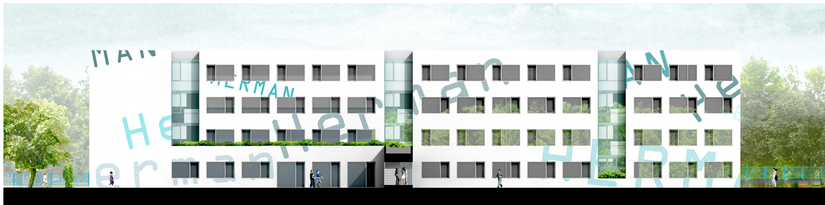
KELETI HOMLOKZAT M1:200