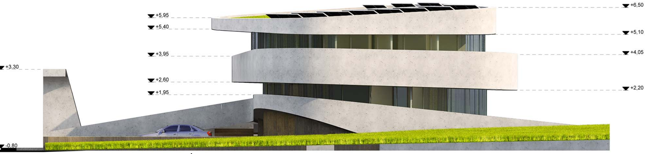
ÉSZAK-NYUGATI HOMLOKZAT M=1:100