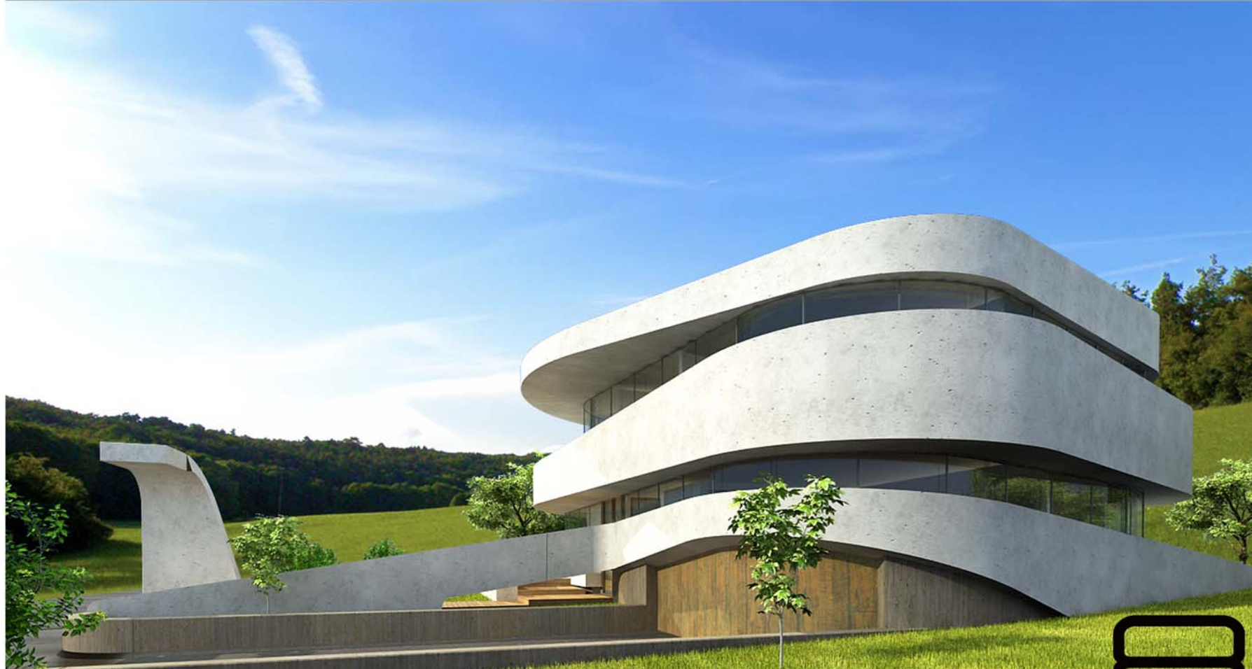
HOMLOKZATOK, METSZET 8