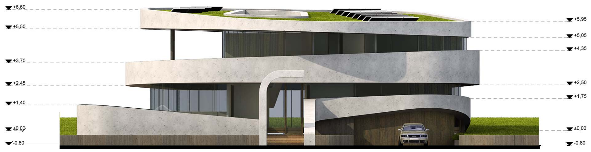
ÉSZAK-KELETI HOMLOKZAT M=1:100