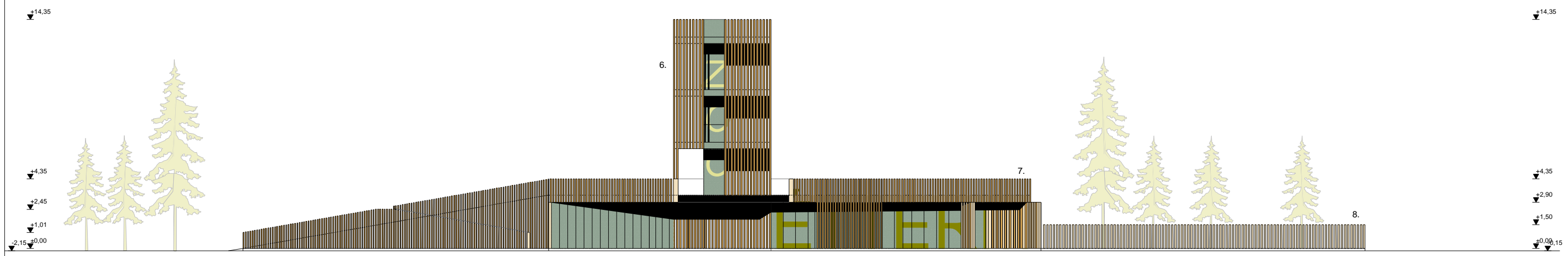
Nyugati (Belső) Homlokzat, B-B Metszet M 1: 250 nyitott lamellákkal