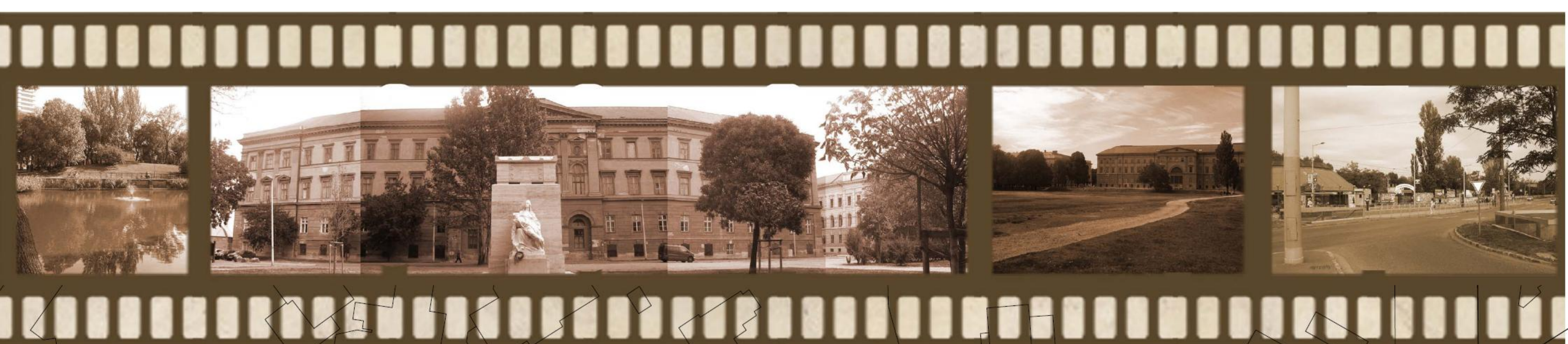
Ludovika Akadémia előtt lévő, két ellenévet megformáló téralakítás (1837)