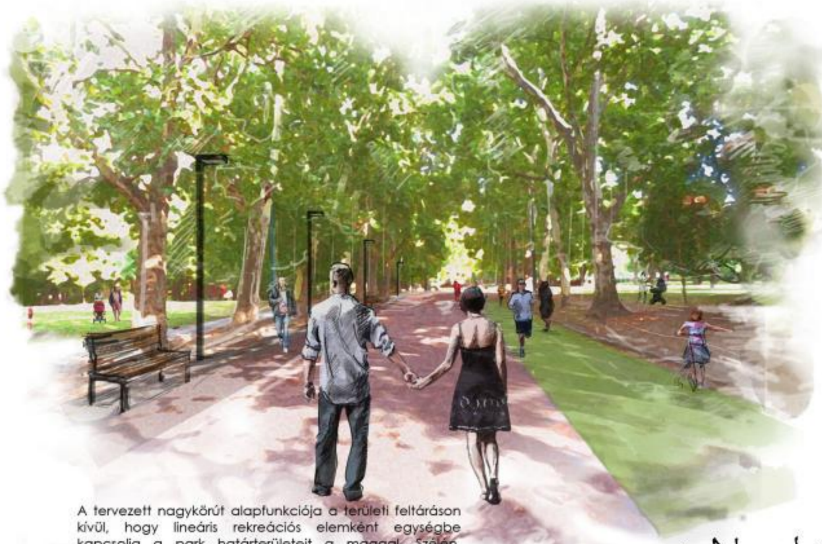
A tervezett nagykörút alapfunkciója a területi feltáráson kívül, hogy lineáris rekreációs elemként egységbe kapcsolja a park határterületeit a mággi szélien, rugalmas futósáv kap helyet.

A korábban létrejött útstruktúra mentendő elemek adják a park útstruktúrájának vázát.