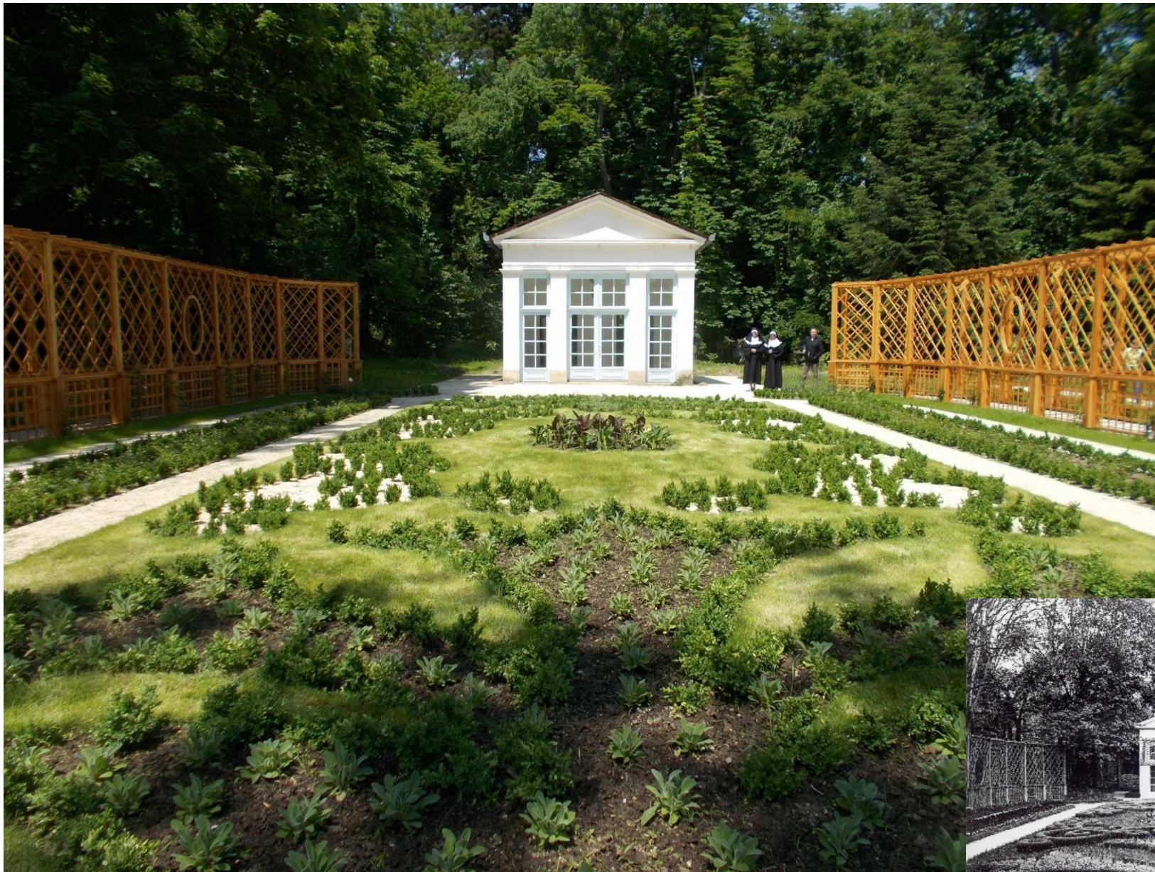
6. Babaház kertje felújítás után és a tervezés alapjául szolgáló archív fotón