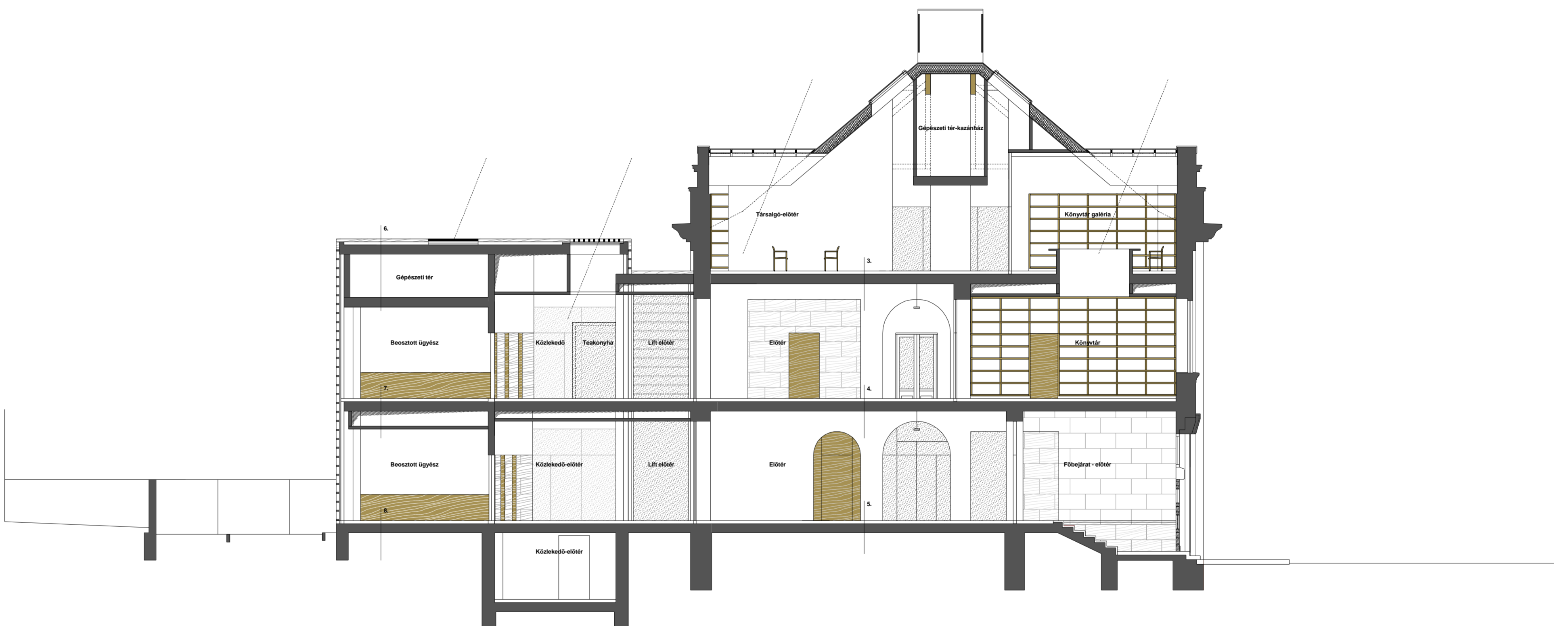
B-B Metszet M 1:100