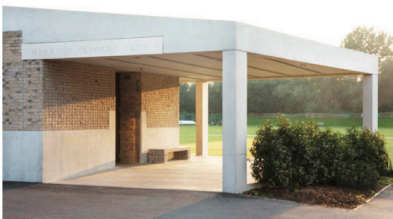
Cricket Club sportöltözője - Dublin

Veszprém jó eséllyel pályázik az Európa Kulturális Fővárosa (EKF) rendezvénysorozatra, többek között ez a hely is kiválóan alkalmas lehet rendezvényhelyszínnek. Egyszerű megközelítés és parkolás, de különleges atmoszféra. Eleinte a Pajta utcai parkoló bővítését javasoljuk, később, ha szükséges az EKF fejlesztési területen további parkolók létesíthetők. Miközben a térséget lehatároljuk két új lakóház méretű épülettel, egyúttal a szomszédos lakóházak kertjeinek intimitását meg is védjük. A területen álló, egykor szebb napokat látott tornatermet felújítjuk, két új épülettel funkcionálisan kiegészítjük, így alkalmassá válik rendezvények megtartására, akár majd az EKF