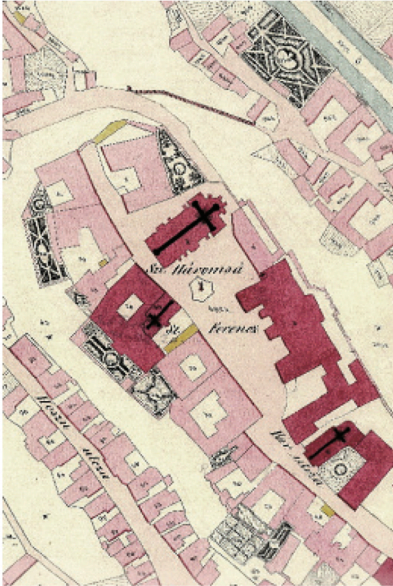
Barokk kertek a veszprémi várban

-Mi ön szerint a veszprémi vár aranykora?