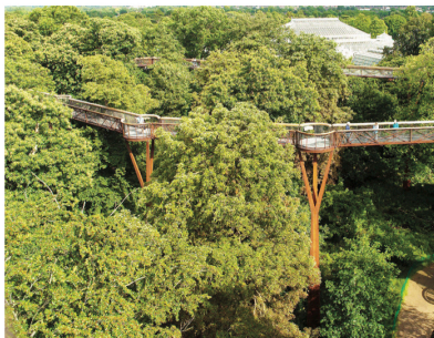
Treetop walkway - Angol Királyi Botanikus Kert

-Úgy is mondhatjuk, hogy a meredek hegyoldal öntörvényű?