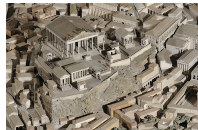
Városmakett - Róma

Hiszek a jóhiszeműségében, kíváncsiságában. Magamból indulok ki. Megérkezem valahová. Leparkolok, kávé szeretnék. Kapok. Miközben fölnezek, összeáll a fejemben a már említett kép. Sötétjebb képek jönnek, ahogy belépek a fogadóépületbe. Az üvegtetőn át keretezett kép tárul elém. A kép témája: a feljutás. Elindulok kedves meglepetés fogad: a vár gyönyörű