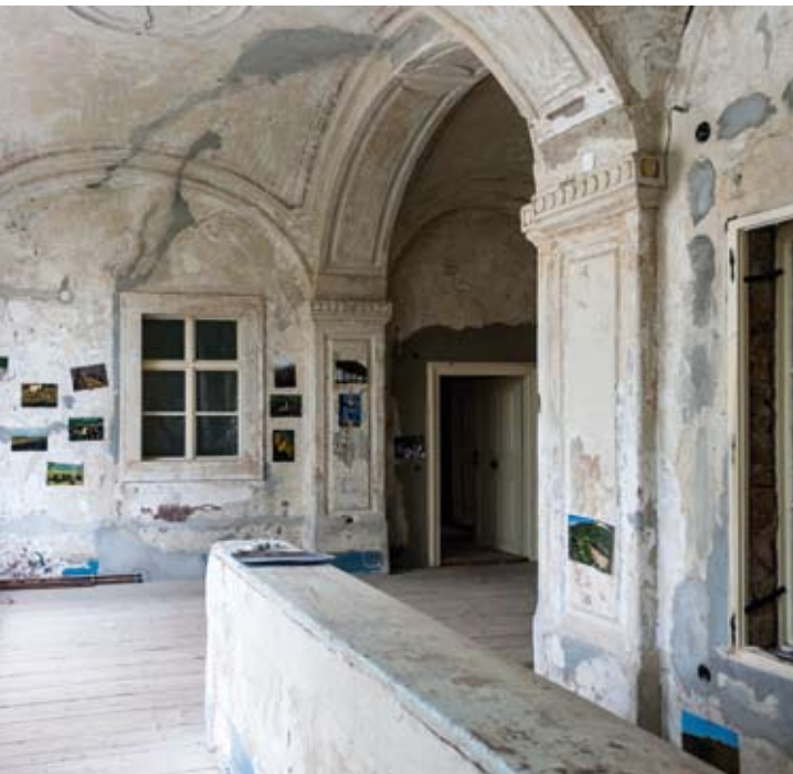
A FELÚJÍTÁS ELŐTTI ÁLLAPOT

1708-ban maga a vezérlő nagyfejedelem, II. Rákóczi Ferenc is megszállt a kúriában, ez a hasznosítás nem idegen az épülettől.