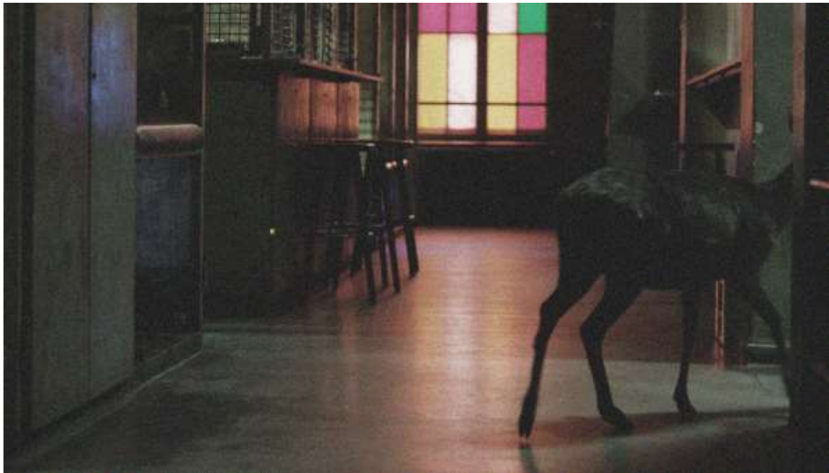
Berghain, Panorama Bar