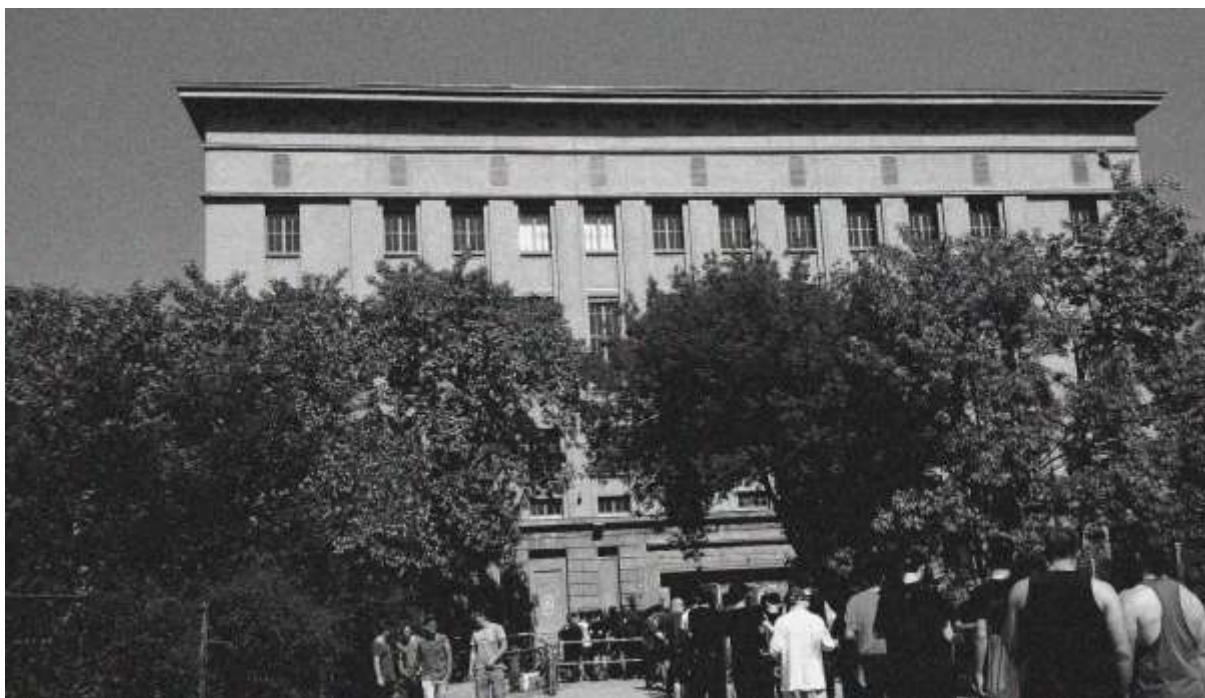
Berghain, a sor