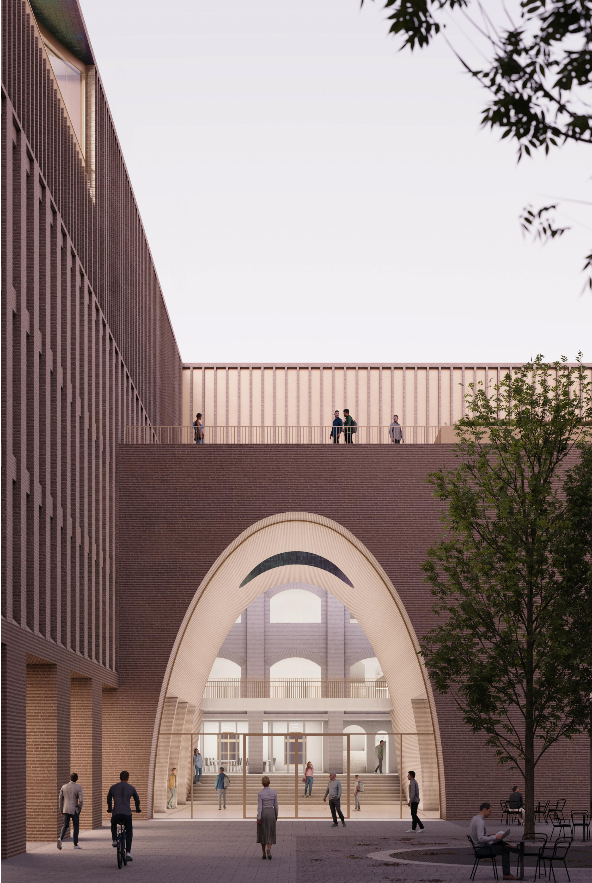
↓ Látvány az egyetem főbejáratairól. Az előcsarnokon átérve a volt dohányraktár homlokzata, immár belső téri helyzetben látható. Balra fenn a tanácsterem reprezentatív terasz, lent a földszinti rendezvényterem előtti árkádsor.