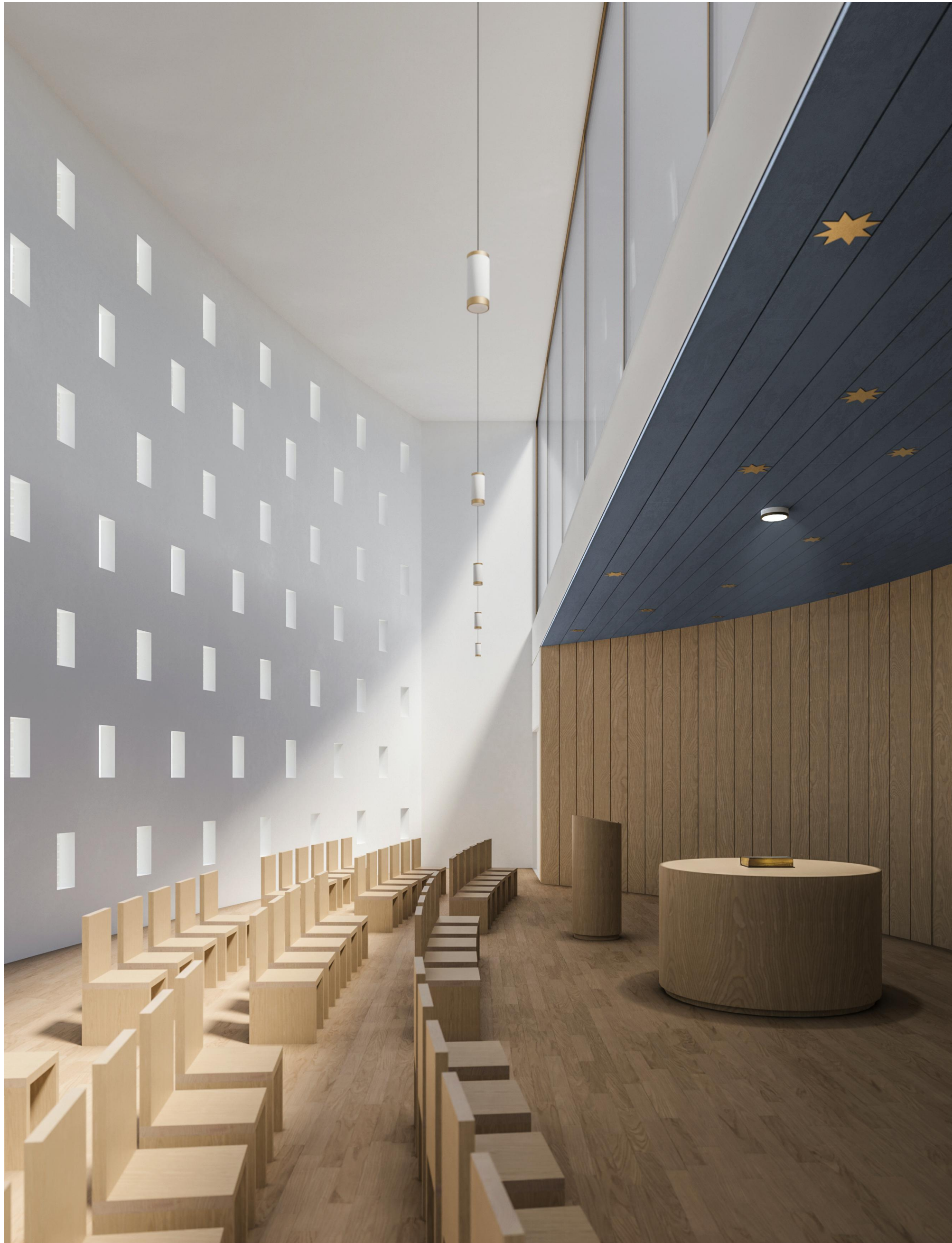
↑ Az egyetemi kápolna látványterve. Az úrasztala feletti a festett mennyezet falusi református templomokat idéz.