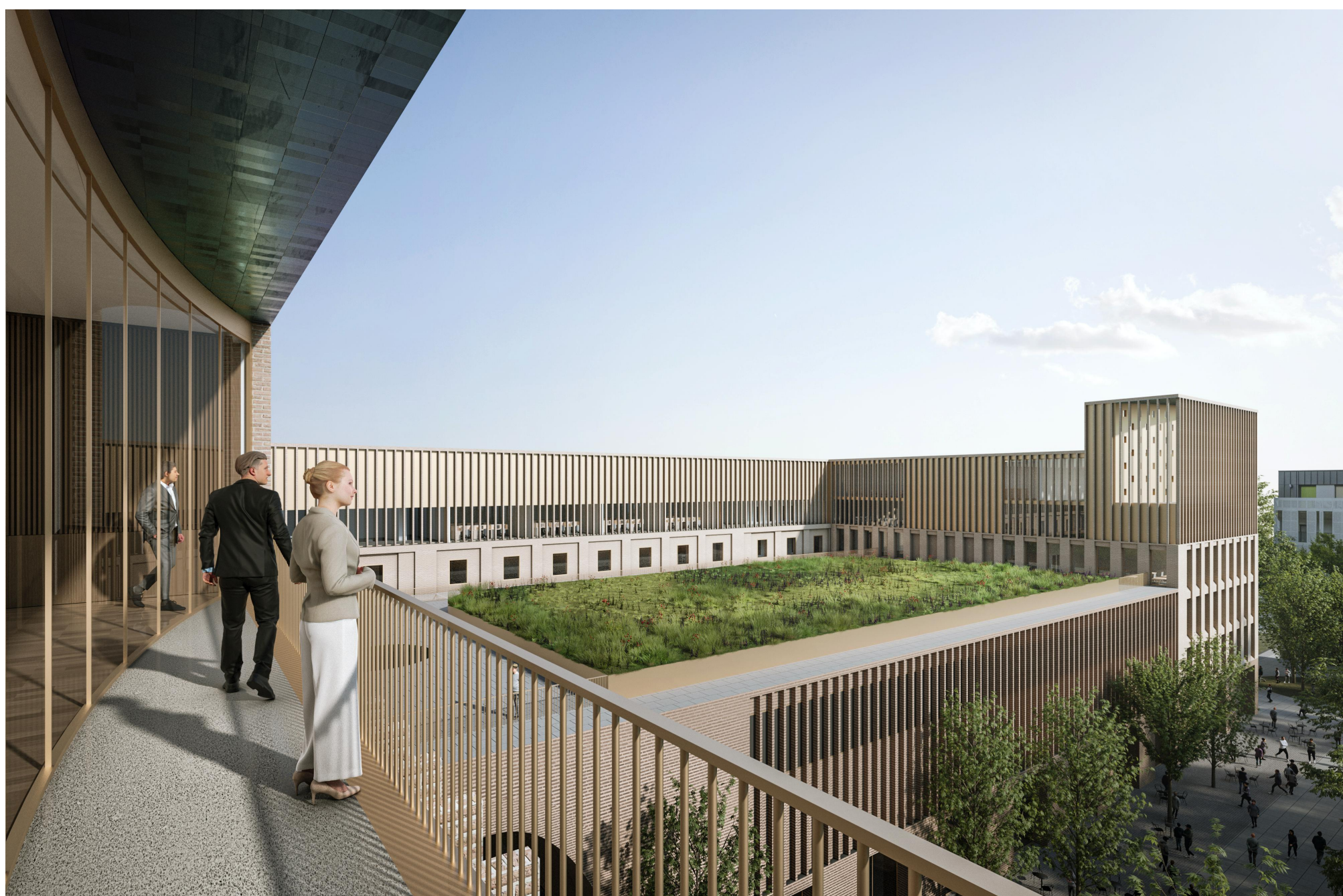
↑ Látvány a tanácsterem fedett teraszáról. Jobbra a harmadik emeleti tetőterasz és az egyetemi kápolna toronyszerű tömege.

Téri- és tömegalakítási hangsúlyok: az előcsarnok, a kápolna és a tanácsterem A homlokzati rendből 3 kiemelt szerepű, az egész campus szempontjából meghatározó, szimbolikus tér homlokzati-téri megformálása alakul egyedi, expresszív irányban.